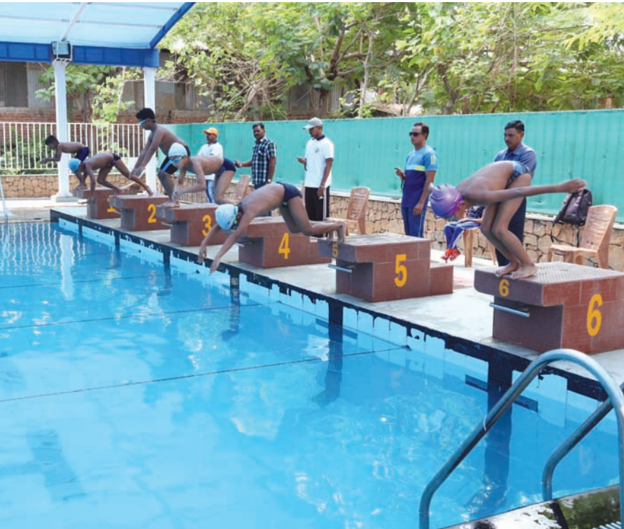
ડિવાઈન ચાઈલ્ડ સ્કૂલ, અડાલજ ખાતે બાળકો માટે જિલ્લાકક્ષાની તરણ સ્પર્ધા યોજવામાં આવી હતી.

ધણું સૂચક માનવામાં આવે છે. મહત્વનું એ છે કે બાયડ શંકરસિંહ વાઘેલાના પુત્ર મહેન્દ્રસિંહનો મત વિસ્તાર છે. તેમણે જે રીતે ચૂંટણી નહીં લડવાનો સંકેત આપ્યો છે તેનાથી રાજકીય વર્તુળોમાં ચર્ચા તેજ થઈ ગઈ છે કે શું શંકરસિંહ આગામી ચૂંટણી નહીં લડે અને નિવૃત્તિ લઈ લેશે. શંકરસિંહ વાઘેલાએ એક કાર્યક્રમમાં આપેલા સંકેતથી તેઓએ આગામી ચૂંટણી લડવા પર મૌન તોડ્યું છે. જેમાં તેમણે ચૂંટણીઓ બહુ લડયા હવે સમાજના પ્રશ્નો માટે લડવાનું છે તેમ ગભિત વાત કરવાનો પ્રયાસ કર્યો છે. અત્રે ઉલ્લેખનીય છે કે શંકરસિંહ વાઘેલાએ ટવીટર પર પણ કોંગ્રેસ ઉપાધ્યક્ષ રાહુલ ગાંધીને અનફોલો કર્યા હતા એટલું જ નહીં તેમણે ભાજપ માટે કરેલી કેટલીક ટવીટો પણ દૂર કરી નાંખી હતી.