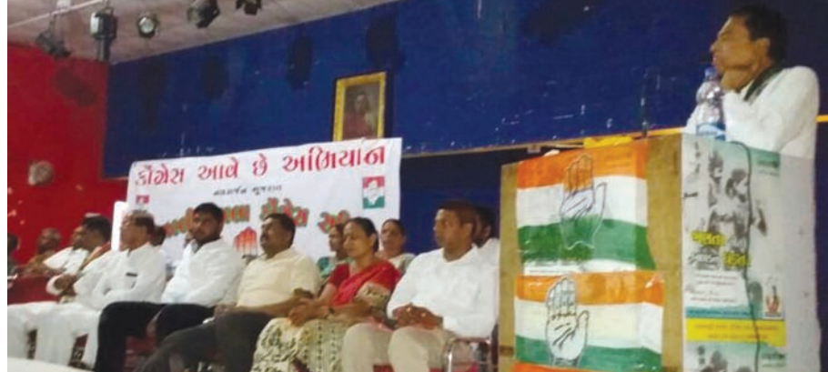
નવસર્જન ગુજરાત માટે કોંગ્રેસ આવે છે કાર્યક્રમ મોડાસા ખાતે યોજાયો

અરવલ્લી જિલ્લાના મોડાસા શહેરમાં સાતગામ સમસ્ત પ્રજાપતિ પરિવાર દ્વારા કુળદેવી બ્રહ્મણી માતાજીના પ્રથમ મહાયજ્ઞનું આયોજન પ્રજાપતિ સમાજવાડી ખાતે કરવામાં આવ્યું હતું. મોડાસા શહેરની પ્રજાપતિ સમાજવાડી ખાતે યોજાયેલા આ મહાયજ્ઞમાં સમસ્ત સાતગામ પ્રજાપતિ સમાજના લોકો મોટી સંખ્યામાં ઉપસ્થિત રહ્યા હતા. સમસ્ત સાતગામ પ્રજાપતિ પરિવાર દ્વારા આયોજિત આ મહાયજ્ઞમાં ૭૦ દંપતીઓએ યજ્ઞમાં ભાગ લીધો હતો. ૩૫ યજ્ઞકુંડ તૈયાર કરી શાસ્ત્રીજી વિષ્ણુમહારાજ દ્વારા હિન્દુશાસ્ત્રોક્ત વિધિ અનુસાર યજ્ઞવિધિ કરાવવામાં આવી હતી. આ પ્રસંગે મોટી સંખ્યામાં પ્રજાપતિ સમાજના ભાઈ બહેનો હાજર રહ્યા હતા. સમસ્ત પ્રજાપતિ સમાજની કુળદેવી બ્રહ્મણી માતાજીના પ્રથમ મહાયજ્ઞ સમાજ એકતા, સુખસંપત્તિ, વ્યસનમુક્તિ અને દીકરીઓ ભણીગણીને આગળ વધે તેવા આશયથી મહાયજ્ઞનું આયોજન કરવામાં આવ્યું હતું. આ મહાયજ્ઞમાં આમંત્રિત સંતો દ્વારા આશિર્વાચન આપવામાં આવ્યા હતા. અને સમાજમાં એકતા જાળવવા અપીલ કરી હતી. સાત ગામ પ્રજાપતિ સમાજના લોકોના સહયોગથી કુળદેવી બ્રહ્મણી માતાજીનો મહાયજ્ઞ સફળ થયો હતો.