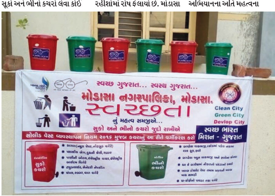
વ્યક્તિ કે ગાડી ન મોકલતા નગરપાલિકાના સ્વચ્છતા પાયલોટ પ્રોજેક્ટનું

મોડાસા, તા. ૨૨ મોડાસા નગરપાલિકા દ્વારા મોડાસા શહેરનો પોશ વિસ્તાર ગણાતી નાલંદા-૨ સોસાયટીમાં સોલીડ વેસ્ટ વ્યવસ્થાપન નિયમ-૨૦૧૬ મુજબ પાલન કરવા પાયલોટ પ્રોજેક્ટ હાથ ધરવામાં આવ્યો હતો. એક મહિના અગાઉ નગરપાલિકા તંત્રએ નાલંદા-૨ સોસાયટીના ૭૦ જેટલા ઘરોમાં ભીના કચરા અને સૂકા કચરા માટે રૂ. ૧૦૦ ફી રહીશો પાસેથી ઉઘરાવી લાઇ અને લીલા કલરની ડસ્ટબીન આપી સૂકા કચરો અને ભીનો કચરો અલગ-અલગ નાખવાની સમજણ આપી. આ જુદા જુદા કચરો લેવા ફક્ત એક જ દિવસ વ્યવસ્થા કર્યા બાદ એક મહિનો થવા છતાં નગરપાલિકા તંત્ર