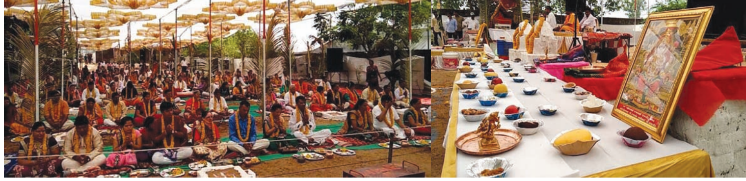
મોડાસામાં સમસ્ત પ્રજાપતિ સમાજ દ્વારા પ્રથમ મહાયજ્ઞ યોજાયો