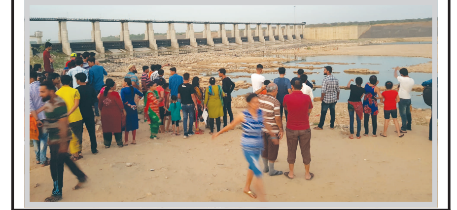
સિકચુરીટી ગાર્ડ ઉપરાંત આ પોઈન્ટ ઉપર 'લાઈફગાર્ડ' મુકવા જરૂરી બન્યા : જોખમી બનેલા આ પીકનીક પોઈન્ટ ઉપર ચોકકસ ગાર્ડ લાઈન તૈયાર કરવાની તાતી જરૂર

નદાવા પડેલા વધુ બે યુવાનો ડુબી ગયા : બેજવાબદાર તંત્રને સંત સરોવરમાં ડુબવાના વધતા કિસ્સાઓ અટકાવવામાં કોઈ રસ નથી