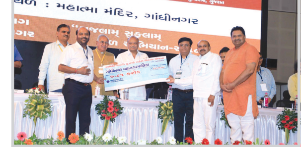
નગરપાલિકાઓ કલોલ અને દહેગામને પણ પોણા બે કરોડની રકમના ચેક એનાયત કરવામાં આવ્યા હતા.

ગાંધીનગર, તા. ૭ મુખ્યમંત્રી સ્વર્ણિમ શહેરી વિકાસ યોજના અંતર્ગત ગાંધીનગર મહાનગરપાલિકાને રૂ. ૭.૮૧ કરોડનો ચેક મળ્યો છે જ્યારે બે