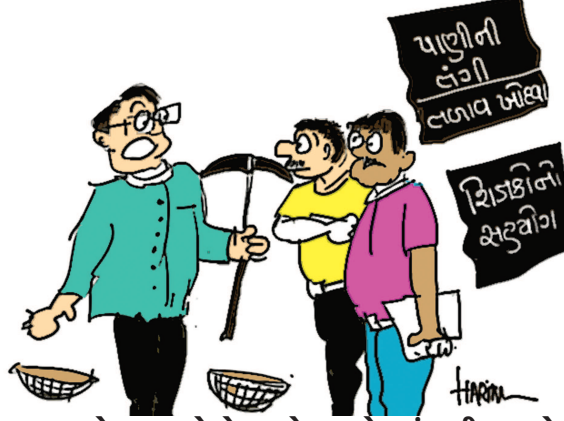
ગુણોત્સવ, પ્રવેશોત્સવને વાર છે ત્યાં સુધી આપણે તળાવ ઉડા કરવાનો ખાડોત્સવમાં ફરજિયાત ભાગ લેવાનો છે.