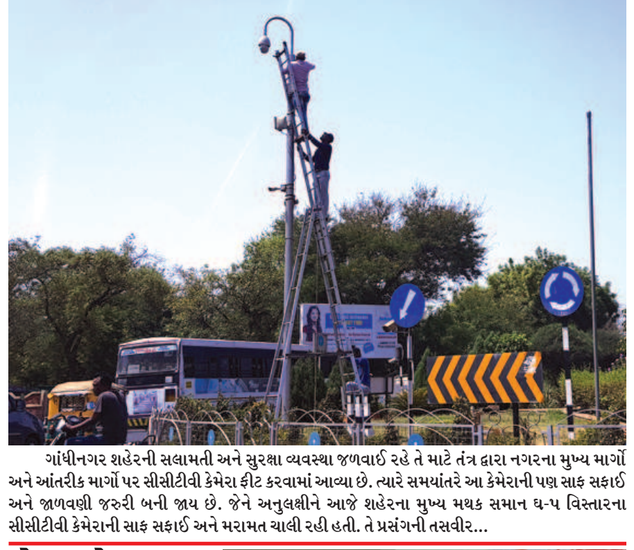
ગાંધીનગર શહેરની સલામતી અને સુરક્ષા વ્યવસ્થા જળવાઈ રહે તે માટે તંત્ર દ્વારા નગરના મુખ્ય માર્ગો અને આંતરીક માર્ગો પર સીસીટીવી કેમેરા ફીટ કરવામાં આવ્યા છે. ત્યારે સમયાંતરે આ કેમેરાની પજ સાફ સફાઈ અને જાળવણી જરૂરી બની જાય છે. જેને અનુલક્ષીને આજે શહેરના મુખ્ય મથક સમાન ધ-૫ વિસ્તારના સીસીટીવી કેમેરાની સાફ સફાઈ અને મરામત ચાલી રહી હતી. તે પ્રસંગની તસવીર...

ચિલોડા સ્વીકાર કેન્દ્ર ખાતે ધો. ૧માં ખાનગી પ્રાથમિક શાળામાં પ્રવેશ માટે ૨૦૫ બાળકોએ ફોર્મ ભર્યા ચિલોડા, તા. ૧૦ રાઈટ ટુ એજ્યુકેશન એક્ટ હેઠળ ખાનગી પ્રાથમિક શાળાઓ માં ૨૫ ટકા મુજબ વિનામુલ્યે ધો. ૧માં નબળા અને વંચિત જૂથના બાળકોને પ્રવેશ આપવો ફરજિયાત છે. ત્યારે રાજ્ય સરકાર દ્વારા આ કાયદાનો અમલ થાય તે માટે પાસ પગલા ભરી રહી છે. તેને લઈને જે બાળકો તા. ૬ જૂન ૨૦૧૮ના રોજ પાંચ વર્ષ પૂર્ણ કર્યા હોય તે બાળક માટે આ યોજના હેઠળ પ્રવેશને પાત્ર છે. આ યોજના હેઠળ અનાથ, સંભાળ અને સંરક્ષણની જરૂરીયાતવાળા બાળગૃહના મંદબુદ્ધિના, પાસ જરૂરિયાતવાળા, શારીરિક વિકલાંગ એચઆઈવી અસરગ્રસ્ત શરીર થયેલા જવાનોના બાળકો, ૦ થી ૨૦ આંક ધરાવતા તમામ