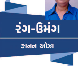
રંગ-ઉમંગ કાનન ઝોળા

કશુંક થવાનાં સપનાં દરેકને આવાં ઢોય છે અને આમાંથી બંધાં કંઈ કશુંક કરી શકે કે કશુંક થઈ શકે તેમ બનતું નથી. આવાં મા-બાપ પોતાનાં અધૂરા સંપનાઓનો ભંગાર બાળકોનાં મનમાં ઢાલવે છે. બાળક એક સ્વતંત્ર હસ્તી છે. એ વાત જ વિસારે પાડી દેવાય છે. બાળકને પોતાનું આગવું રુચિતંત્ર છે. આંતરિક જગત છે. એવો બ્યાલ જ ઘણા મા-બાપને ક્યારેય આવતો નથી. કેટલાંક બહુ પ્રવૃત્તિશીલ મા-બાપની પાસે તો બાળકો માટે સમય પણ હોતો નથી. આવાં મા-બાપના સમયનું રોકાણ પૈસા અને પ્રતિષ્ઠા રળવા માટે થતું હોય છે. આવા મા-બાપ પોતાની બહુ પ્રિય પ્રમાણે બાળકોનું ઘડતર કરવાનો ક્રોન્ડેક્ટ શિક્ષકોને આપી દે છે. એટલે બાળકને કાં મા-બાપ દ્વારા કાં શિક્ષકો દ્વારા ઉપદેશો ને હુકમો જ ઝીલ્યા કરવા પડે છે. આઈન્સ્ટાઈને સરસ વાત કહી છે કે - 'બાળક એક જ્યોતિ છે. દરેક જ્યોતિ એક સરખું અજવાળું આપી શકતી નથી, પણ દરેક જ્યોતિ ભલે પોતાની શક્તિ અનુસાર - અજવાળું આપી શકે છે તે નક્કી વાત છે.' જ્યોતિ ને તમે પ્રગટાવી શકો છો, પવનના ઝપાટાથી એ બુઝાઈ ન જાય એની તકેદારી રાખી શકો; પણ તમારે જોઈએ છે એવો ને તમારે જોઈએ છે એટલો પ્રકાશ એણે આપવો જ જોઈએ. એવો આગ્રહ ન રાખી શકો. જ્યોતિ જેટલો પ્રકાશ આપે એટલા પ્રકાશનું તમારે સ્વાગત કરવું જોઈએ. આજુ જ બાળકનું છે. એને તમારે એની રીતે વિકસાવવાનું છે. એની શક્તિ એટલે બાળકને કાં મા-બાપ દ્વારા કાં શિક્ષકો દ્વારા ઉપદેશો ને હુકમો જ ઝીલ્યા કરવા પડે છે.