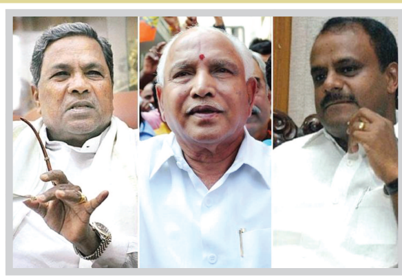
● અનુસંધાન પાન-૭ પર

રહી છે જેથી ભાજપ અને કોંગ્રેસ તેમજ જેડીએસ દ્વારા પોત પોતાની રીતે પણ નવા સમીકરણ બેસાડી દેવાના પ્રયાસ શરૂ કરવામાં આવ્યા છે. ક્ષણાટકમાં ભાજપના મુખ્યપ્રધાન પદના દાવેદાર બીએસ યેદીયુરપ્પાએ કહ્યું છે કે ભાજપ ૧૨૫થી ૧૩૦ સીટો જીતી જશે જ્યારે કોંગ્રેસ પાર્ટી ૭૦ના આંકડાને પણ પાર કરી શકશે નહીં. જનતાદળ એસ ૨૪થી ૨૫