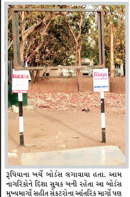
રૂપિયાના ખર્ચે બોર્ડ્સ લગાવાયા હતા. આમ નાગરિકોને દિશા સુચક બની રહેતા આ બોર્ડ્સ મુખ્યમાર્ગો સહીત સેક્ટરોના આંતરિક માર્ગો પણ

ગાંધીનગર તા ૧૪ શહેરમાં ગત વાર્ષિક સમિટ વેળાએ લાખો