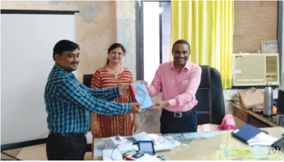
વેબ સાઈટ પર નોંધી શકાશે અને ટીબીને નાબુદ કરવા માટે આ

આધુનિક ઉપકરણો ખુબ જ ઉપયોગી થાય છે. તેવું જિલ્લા આરોગ્ય અધિકારી