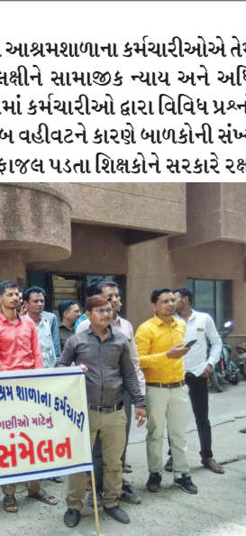
જેથી તે બાળકોના શિક્ષણ પર વધુ ધ્યાન આપી શકે તેવી રજૂઆત આશ્રમશાળાના શિક્ષકોએ કરી છે. આ સાથે રાજ્ય સરકારના તમામ વિભાગોના કર્મચારીઓને સાતમા પગાર પંચનો લાભ આપવામાં આવ્યો છે. આ લાભથી આશ્રમશાળાના કર્મચારીઓને બાકાત રાખવામાં આવ્યા છે. જે સત્વરે આપવા માંગ કરવામાં આવી છે. આશ્રમશાળાના કર્મચારીઓએ રાજ્યના નાયબ મુખ્યમંત્રી નીતિનભાઈ પટેલને પણ આવેદનપત્ર આપવા પ્રયાસ કર્યો હતો પરંતુ તેઓ રૂબરૂ ના મળી શકતા તેમનું આવેદનપત્ર નાયબ મુખ્યમંત્રી કાર્યાલયમાં આપી ફરત કર્યા હતા.

ગાંધીનગર, તા. ૧૫ આજે ગાંધીનગર ખાતે રાજ્યની આશ્રમશાળાના કર્મચારીઓએ તેમને સાતમા પગારપંચનો લાભ આપવા સહિતની પડતર માંગણીઓને અનુલક્ષીને સામાજિક ન્યાય અને અધિકારીતા મંત્રી ઈશ્વરભાઈ પરમારને આવેદનપત્ર અપાયું હતું. આવેદનપત્રમાં કર્મચારીઓ દ્વારા વિવિધ પ્રશ્નોનું નિરાકરણ લાવવા માંગ કરી છે. આશ્રમશાળામાં સંસ્થાના ખરાબ વહીવટને કારણે બાળકોની સંખ્યામાં ઘટ પડે અથવા અન્ય કારણોસર આશ્રમશાળા બંધ કરવી પડે તો તેના ફાજલ પડતા શિક્ષકોને સરકારે રક્ષણ આપવું તેવી માંગ આશ્રમશાળાના શિક્ષકો દ્વારા કરવામાં આવી છે. વળી, આશ્રમશાળામાં મોટા ભાગના શિક્ષકો શિક્ષક કમ ગુહપતિની ફરજ નિભાવે છે. આ બંને જવાબદારીના કારણે તેમનું કાર્ય ૨૪ કલાકનું થઈ જાય છે. આમ ૨૪ કલાક જવાબદારી નિભાવવાને કારણે માનસિક તણાવનો ભોગ બને છે જેની સીધી અસર બાળકોના શિક્ષણકાર્ય પર પડે છે આથી સરકાર દ્વારા ગુહપતિની અલગ નિમણૂક કરવામાં આવે અને શિક્ષકોને ગુહપતિની ફરજમાંથી મુક્ત રાખવામાં આવે જેથી તે બાળકોના શિક્ષણ પર વધુ ધ્યાન આપી શકે તેવી રજૂઆત આશ્રમશાળાના શિક્ષકોએ કરી છે. આ સાથે રાજ્ય સરકારના તમામ વિભાગોના કર્મચારીઓને સાતમા પગાર પંચનો લાભ આપવામાં આવ્યો છે. આ લાભથી આશ્રમશાળાના કર્મચારીઓને બાકાત રાખવામાં આવ્યા છે. જે સત્વરે આપવા માંગ કરવામાં આવી છે. આશ્રમશાળાના કર્મચારીઓએ રાજ્યના નાયબ મુખ્યમંત્રી નીતિનભાઈ પટેલને પણ આવેદનપત્ર આપવા પ્રયાસ કર્યો હતો પરંતુ તેઓ રૂબરૂ ના મળી શકતા તેમનું આવેદનપત્ર નાયબ મુખ્યમંત્રી કાર્યાલયમાં આપી ફરત કર્યા હતા.