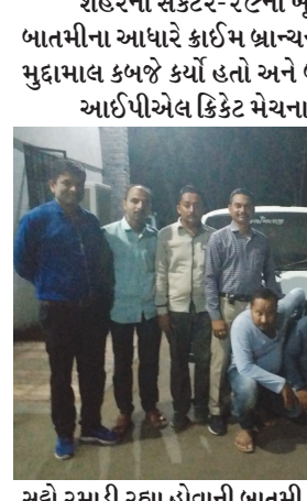
ગાંધીનગર, તા. ૨૧ શહેરના સેક્ટર-૨૮ના ખૂણે માણસો વાનમાં આઈપીએલ ક્રિકેટ મેચના સહો રમાડતા બે સહોડીયાઓને બાતમીના આધારે ક્રાઈમ બ્રાન્ચની ટીમે દબોચી લીધા હતા. ટીમે સહોડીયાઓ પાસેથી રૂ. ૬૩ હજારથી વધુનો મુદામાલ કબજે કર્યો હતો અને બંને આરોપીઓને જેલ હવાલે કર્યા હતા.

પોલીસે બાતમીના આધારે દરોડો પાડી રૂ. ૬૩,૪૦૦નો મુદામાલ જપ્ત કરી સહોડીયા ભાઈઓને જેલ હવાલે કર્યા