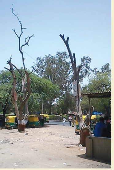
ચિલોડા સહિત મુખ્ય માર્ગો પર અનેક લોકોની અવરજવરથી ધમધમતા વિસ્તારોમાં અનેક

સુકાઈ ગયેલા વૃક્ષો ઉભા છે. જોરદાર વાવાઝોડા કે વધુ વરસાદની થાપટે ધરાશયી થાય તેવી દહેશત પણ સતત હોય છે જ. જે અંગે તંત્રનું ધ્યાન પણ દોરવામાં આવ્યું હતું છતાં કોઈ જ કાર્યવાહી ન થતાં આખરે તંત્રની લાપરવાહીએ એક નિર્દોષને જીવ ગુમાવવાનો વારો આવ્યો છે. જેથી તંત્ર વિરૂધ્ધ ફિટકારની લાગણી ઉભી થવા પામી છે.