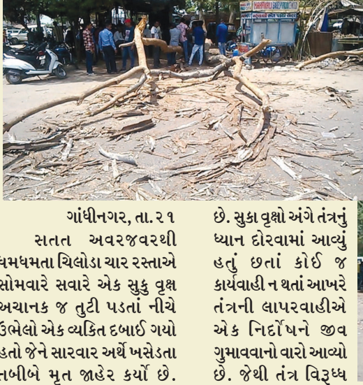
ગાંધીનગર, તા. ૨૧ સતત અવરજવરથી ધમધમતા ચિલોડા ચાર રસ્તાએ સોમવારે સવારે એક સુકુ વૃક્ષ અચાનક જ તુટી પડતાં નીચે ઉભેલો એક વ્યક્તિ દબાઈ ગયો હતો જેને સારવાર અર્થે ખસેડતા તબીબે મૃત જાહેર કર્યો છે. પ્રિમોન્સુન કામગીરી તંત્ર દ્વારા કરવામાં જ ન આવતી હોય તેવા દૃશ્યો હાલમાં પણ મોજુદ બન્યા છે.

તંત્રની લાપરવાહીએ નિર્દોષે જીવ ગુમાવ્યો : ચિલોડામાં અનેક ઠેકાણે હજુ પણ સુકાઈ ગયેલા વૃક્ષો યમદૂત થઈને ઉભા છે