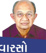
અમર વારતો ડો. રવિમકાન્ત મહેતા

સારસંભાળ કેમ વધી ગઈ છે ? નારદે જવાબ આપ્યો. 'અમે પ્રેમમાં છીએ, અને પરણવાનો સંકલ્પ કર્યો છે.' હવે પવંત મુનિ ગુસ્સે થયા. અને કહ્યું, 'આટલી મોટી વાત તે મારાથી છુપાવી તે વચનદોહ કર્યો છે. તને હું શાપ આપું છું. તારું મુખ વાનરનું થઈ જાય.' નારદે પણ કહ્યું, 'આટલી નાની વાતમાં તે આવડો મોટો શાપ આપ્યો. હું પણ તને પ્રતિશાપ આપું છું. તુ સ્વર્ગલોકમાંથી ભ્રષ્ટ થઈ જા.' બંનેના શાપની અસર થઈ. પવંત દુઃખી થઈને નગર છોડીને જતા રહ્યા. નારદ પણ દુઃખી હતા. દમયંતીને આઘાત લાગ્યો. પણ તે સ્વસ્થ થઈ ગઈ. નારદ અતિથિગૃહમાંથી બહાર ન નીકળ્યા. દમયંતી માટે વર શોધવાનો રાજાએ પ્રયત્ન શરુ કર્યો. 'હું મનથી નારદને વરી ચૂકી છું એમનું વાનરમુખ શાપને કારણે