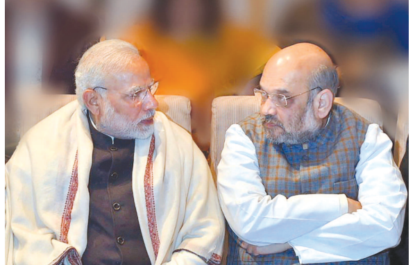
● અનુસંધાન પાન-૭ પર

આવ્યો છે. રાજકીય દ્વેષભાવ માટે સશસ્ત્ર દળોનો ઉપયોગ કરવાનો આક્ષેપ પણ આ ભંગને નેતાઓ ઉપર કરવામાં આવ્યો છે. ચીફ જસ્ટિસ રંજન ગોગોઈના નેતૃત્વમાં બંને કહ્યું હતું કે, ચૂંટણી પેનલ કોંગ્રેસના લોકસભા સાંસદ સુખિતા દેવની ફરિયાદ ઉપર કોઈપણ આદેશ કરવા માટે સ્વતંત્ર છે. આસામમાં સિલ્વરમાંથી કોંગ્રેસના લોકસભા સાંસદ સુખિતા દેવ તરફથી આ ફરિયાદ દાખલ કરવામાં આવી