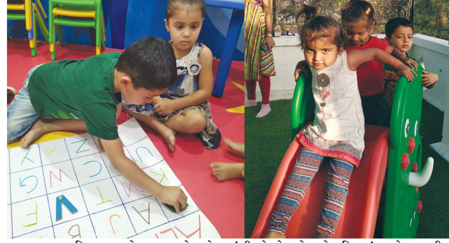
યાજ્ઞક્ય કિડ્સ સ્કૂલ સેક્ટર-૨ માટે તાજેતરમાં ફી પ્લે ઝોન ફોર ઓલ કિડ્સનું આયોજન તારીખ કરવામાં આવ્યું હતું. દરેક વર્ગનાં બાળકોએ આ ઉપક્રમનો વિનામૂલ્યે લાભ લીધો હતો. હવે સ્કૂલ માટે તારીખ ૧લી મેથી ૩૧ મે સુધી સમર કેમ્પનું આયોજન કરવામાં આવેલ છે જેમાં સ્કૂલ તરફથી નક્કી કરીને બીપીએલ હેલ્થ આવતા પાંચ બાળકોને વિનામૂલ્યે લાભ આપવામાં આવશે. આ હેતુ રજીસ્ટ્રેશન (૭૨૬૫૮ ૧૮૫૩) કરાવવું આવશ્યક છે, એમ સ્કૂલ દ્વારા આ અંગેની એક અખબારી યાદીમાં જણાવવામાં આવ્યું છે.