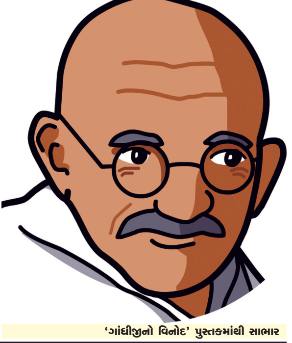
'ગાંધીજીનો વિનોદ' પુસ્તકમાંથી સાભાર

એકવાર જવાહરલાલજી તેમના પિતા સાથે ગાંધીજીને મળવા આવ્યા. સાંજનો સમય હતો. ગાંધીજીની ઓરડીમાં દીવો સળગ્યો હતો પણ જવાહરલાલજી અંદર પ્રવેશે તે પહેલાં જ દીવો ઓલવાઈ ગયો અને બારણા પાસે મૂકેલી બાપુની લાગડી સાથે તેઓ અથડાઈ પડ્યા. તેથી સહેજ ધૂંધવાઈને જવાહરલાલજી બોલ્યા : બાપુ, તમે અહિંસાના પૂજારી છો તો પછી આ લાકડી શા માટે રાખી છે? ગાંધીજી : તમારા જેવા તોફાની છોકરાઓને પાંસરા કરવા માટે. જવાહરલાલજીનો ધૂંધવાટ આ સાંભળી ઓગળી ગયો અને તેઓ હસી પડ્યા.