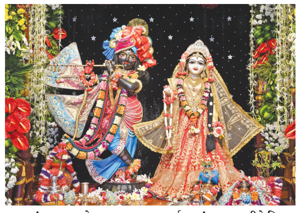
સ્વર્ણરથમાં ભગવાનશ્રીને વિહાર કરાવવામાં આવશે અને ત્યાર બાદ સુંદર પુષ્પોથી સુશોભિત નૌકામાં મંદિરના વિશાળ કુંડમાં વિહાર કરાવવામાં આવશે. આ વિશાળ