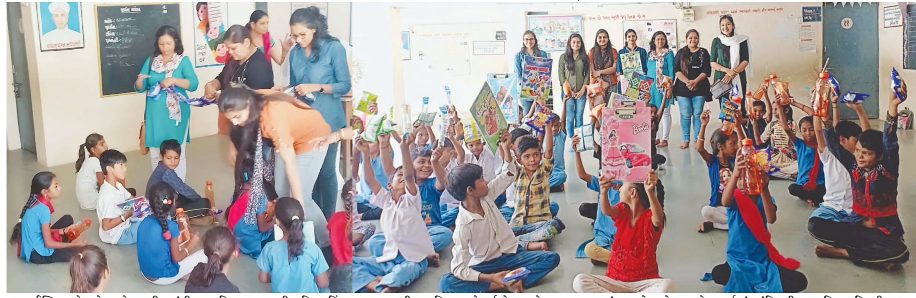
ઈન્ડિયન રેડ ક્રોસ સોસાયટી, ગાંધીનગર જિલ્લા શાળાની મહિલા વિંગ દ્વારા સરકારી પ્રાથમિક શાળા, મુકબધર વિદ્યાલય, આદિવાડા અને ચરેડી આંગણવાડી, સેક્ટર-૨૮નાં બાળકોને કંપાસ કિટ, પાણીની બોટલ્સ, રાઈટીંગ પેડ, ચોપડાનું વિતરણ કરવામાં આવ્યું હતું. બાળકોને ઠંડાં પીણાં સાથે