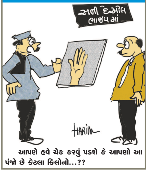
આપણે હવે ચેક કરવું પડશે કે આપણો આ પંજો છે કેટલા કિલોનો...??