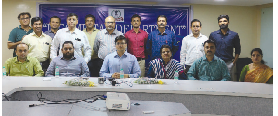
દહેગામની બક જુઆઈડીસી ખાતે ઈન્કમેટેક્સ અવેરનેસ કેમ્પેઈન યોજાયું