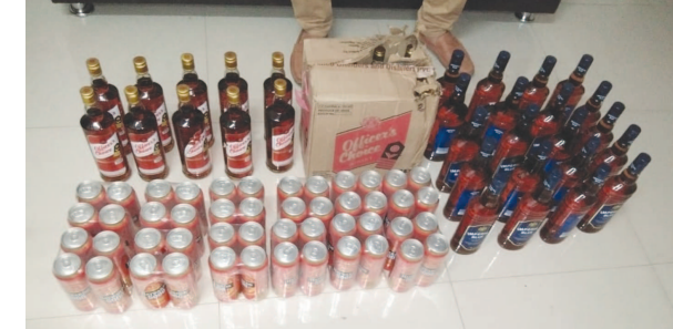
નાકાબંધી કરી હતી પોલીસ બંદોબસ્ત જોઈ બજાજ પલ્સર (ગાડી.નં.૩૧ ૩૦ ૦૪૦૨) પર સવાર બુટલેગર બાઈક રોડ પર નાખી ભાગવા જતા તેને પકડવા એલસીબી પોલીસે પીછો કરતા પોલીસ ને માત આપી બુટલેગર

અરવલ્લી જલ્લાની રાજસ્થાન રાજ્યને જોડતી વિવિધ સરહદો પરથી મોટા પ્રમાણમાં નિતનવા નુસખા અપનાવી વિદેશી દારૂ યુસાડવા સતત પ્રયત્નશીલ રહે છે જલ્લા એલસીબી પોલીસે જીવણપૂર-ગડાદર રોડ પર ભાતમીના આધારે નાકાબંધી કરી હતી મણિપુર કંપા નજીક હાઈસ્પીડ બાઈક પર વિદેશી દારૂ ભરી આવનાર બુટલેગર પોલીસને જોઈ બાઈક રોડ પર નાખી દઈ નાસી ગયો હતો પોલીસનો પીછો ટૂંકો પડતા પોલીસે હાઈસ્પીડ બાઈક અને રૂ.૩૨૪૦૦/- નો વિદેશી દારૂનો જથ્થો જપ્ત કરી સંતોષ માનવો પડ્યો હતો.