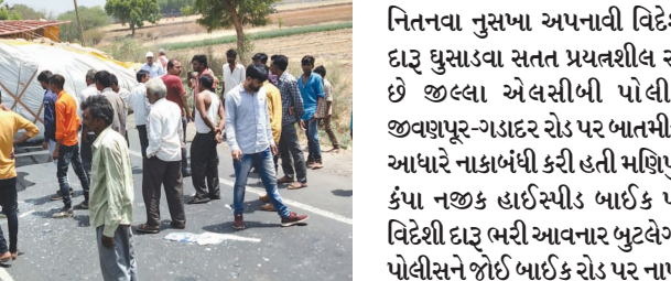
બની રહ્યા છે. ભારવાહક ચાલકોની બેફિક્રાઈભયી ડ્રાઈવિંગ અનેક લોકોનો ભોગ લીધો છે.

મોડાસા-નાડિયાદ રાજ્યધોરી માર્ગ સતત ભાર વાહક વાહનોથી ધમધમી રહ્યો છે. ટ્રક-ટ્રેલર, ટેન્કર અને ડમ્પર ચાલકો બેફામ ગતિએ હંકારતા સતત અકસ્માતનો ભોગ નાના વાહનચાલકો અને રાહદારીઓ