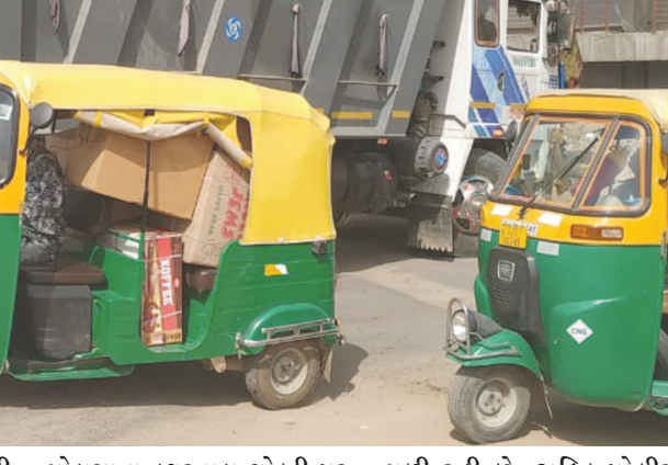
ટ્રાફિક સમાહની જો રશો રથી ઉજવણી કરતી ટ્રાફિક પોલીસ અને આરટીઓ તંત્ર પાનાપૂર્તિ અને દેખાવપૂર્તિ કામગીરી કરી સંતોષ માનતા ટ્રાફિકની સ્થિતિ ત્યાંને ત્યાંજ જોવા મળી રહી છે. મોડાસા શહેરમાં રીક્ષાચાલકો રીક્ષા બેફામ

મોડાસા, તા. ૩ અરવલ્લી જલ્લાના મુખ્યમથક મોડાસા શહેરના ટ્રાફિકની સમસ્યા શહેરીજનો માટે માથાના ઢુબાચા સમાન બની છે.