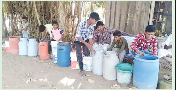
તો અબોલ પશુઓ માટે તો પણ પાણીની વ્યવસ્થા કરોગામલોકો દ્વારા તલાટીને પાણી બાબતે રજૂઆત કરતાં તલાટી દ્વારા ગામ ને ટેન્કર દ્વારા પાણી પૂરું પાડવામાં આવે છે અને એ પણ બે દિવસમાં ફક્ત એક જ પાણીનું ટેન્કર આપવામાં આવે છે અને આ ગામમાં લોકોને પૂરતું પાણી મળતું નથી જ્યારે પછ ટેન્કર આવે ત્યારે લોકો પાણી માટે પડાપડી કરે છે અને લોકો પોતાના વાસણો લઈ પાણી માટે લાઈનમાં ઉભા રહે છે કેટલાક લોકોને પાણી મળે છે તો કેટલાક લોકોને પાણી નથી મળતું આવી જ રીતે લોકો ખૂબ