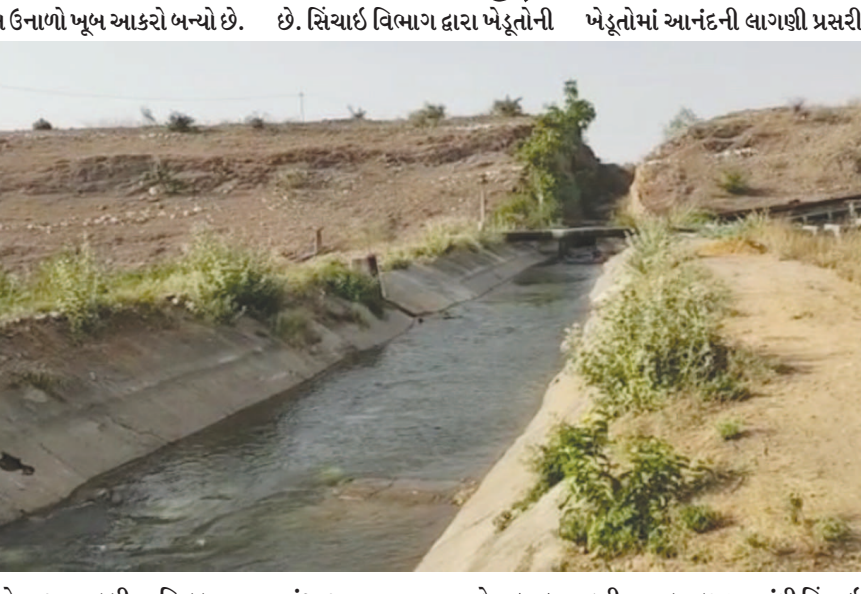
હાલ ઉનાળો ખૂબ આકરો બન્યો છે. છે. સિંચાઈ વિભાગ દ્વારા ખેડૂતોની ખેડૂતોમાં આનંદની લાગણી પ્રસરી