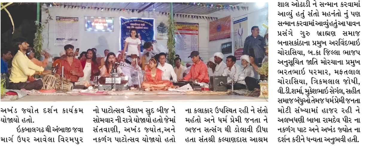
અખંડ જ્યોત દર્શન કાર્યક્રમ નો પાટોત્સવ વૈશાખ સુદ બીજ ને સોમવાર ની રાત્રે યોજાયો હતો જેમાં સંતવાણી, અખંડ જ્યોત, અને નકર્ગળ પાટોત્સવ યોજાયો હતો ના કલાકાર ઉપસ્થિત રહી ને સંતો મહંતો અને ધર્મ પ્રેમી જનતા ને ભજન સત્સંગ થી ડોલાવી દીધા હતા સંતશ્રી કલ્યાણદાસ આશ્રમ

મોટી સંખ્યામાં સંતો મહંતો સાથે ધર્મપ્રેમી જનતા ઉમટીને લ્હાવો લીધો ગામમાં આવેલા સંતશ્રી કલ્યાણદાસ આશ્રમ ખાતે શ્રી રામદેવપીર ધામ, સંતશ્રી કલ્યાણદાસ આશ્રમ ખાતે સંતવાણી કાર્યક્રમ અને અખંડ જ્યોત દર્શન કાર્યક્રમ યોજાયો હતો. આ સંસ્થાના સભ્યોએ આજના રોજ વિશ્વ રેડ કોસ દિવસની ઉજવણી કરવામાં આવી હતી. આ સંસ્થાના સભ્યોએ આજના રોજ વિશ્વ રેડ કોસ દિવસની ઉજવણી કરવામાં આવી હતી.