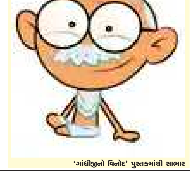
'ગાંધીજીનો વિનોદ' પુસ્તકમાંથી સાભાર

હાઈકોર્ટેના મોટા વકીલને વાસણ ઘસતા કરી મૂક્યા તેનો યશ તો મને જ મળે છે ને ?