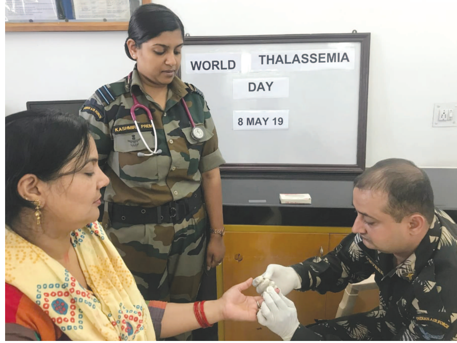
સાઉથ વેસ્ટર્ન એર કમાન્ડનાં તમામ સ્ટેશનો પર ૦૮ મે, ૨૦૧૯નાં રોજ વિશ્વ થેલેસેમિયા દિવસની ઉજવણી કરવામાં આવી હતી. આ ઉજવણીની શરૂઆત અધિકારીઓ અને તેમનાં પરિવારજનોને થેલેસેમિયા વિશેની જાણકારી આપીને કરવામાં આવી હતી તથા રોગનું નિદાન વહેલાસર કરવા માટે તેનું પરીક્ષણ કરીને શરૂઆત કરવામાં આવે છે એવી માહિતી આપવામાં આવી હતી.

કરવામાં આવેલ છે. આ નાટકનો મૂળ ખ્યાલ અને લેખન જાણીતા લેખક, દિગ્દર્શક અને એક્ટર દિપક અંતાણીનો છે. આ નાટકની સ્ક્રીપ્ટને ગાંધીજીના પ્રખ્યાત તુષારભાઈ ગાંધીએ વાંચી છે અને વખાણી છે. તેમણે એવો પણ ભાવ પ્રદર્શિત કરેલ છે કે આ નાટકનું નિર્માણ થવું જ જોઈએ અને વધારે ન વધારે લોકો સુધી ગાંધી વિચારને સત્ય સાથે, યોગ્ય સ્વરૂપમાં અને તટસ્થ રીતે પહોંચાડવાનો પુરુષાર્થ થવો જોઈએ. જેની સિધ્ધિ અને ક્ષમતા સમગ્ર વિશ્વ માને છે તેવા રાષ્ટ્રપિતા મહાત્મા ગાંધીજીના વિચારોની આજે જરૂરિયાત, તેમના જીવન સાથે જોડાયેલા અમુક ખાસ પ્રસંગો માટેના વિવિધ ખ્યાલોમાં ગાંધીજીના પક્ષે રહેલ હકીકતો અને તેમનો વિચાર જેવા કેંદ્રવર્તી મુદ્દાઓ સાથે આ નાટકનું નિર્માણ થયું છે. એકદમ સરળ શૈલીમાં રજૂ થતાં આ નાટકમાં યુવા કલાકારો મયુર ભાટિયા, ઝરુરાજ રોય, યશ વેંકણ, ફરાજ રાઉમાં, વિજય ગઢવી, સાગર ઠક્કર, ધવલ રાજવંશ, પાર્થ ત્રિવેદી, મીત જોશી, મનન નાયક, ધ્વનિ ઓઝા અને યુગ રાવલે અભિનય આપી રહ્યા છે. નાટકનું સહ નિર્દેશન અને સંકલન નીરવ વેંગડાએ કર્યું છે.