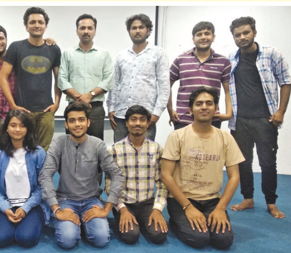
રાજકોટ રોજ કરશે. જોધપુર, રાજસ્થાનના શ્રી જયનારાયણ વ્યાસ સ્મૃતિ ભવન ખાતે આ નાટ્ય પ્રસ્તુતિ કરવામાં આવશે. મહાત્મા ગાંધીજી પર કેન્દ્રિત આ નાટકનું નિર્માણ અને મુખ્ય દિગ્દર્શન ગુજરાતના જાણીતા લેખક અને દિગ્દર્શક જીગર રાણા દ્વારા

ગાંધીનગર, તા. ૯ રાજસ્થાન સંગીત નાટક અકાદમી, જોધપુર અને પશ્ચિમ શેંગ સાંસ્કૃતિક સંસ્થાન, ઉદયપુર દ્વારા કસ્ટોમર રીટે તારીખ ૦૭ થી ૧૦ મે, ૨૦૧૯ દરમિયાન એક બહુભાષિય નાટ્ય મહોત્સવનું આયોજન જોધપુર, રાજસ્થાન ખાતે ચાલી રહ્યું છે. આ મહોત્સવમાં ખાસ પ્રસ્તુતિ માટે અન્ય રાજ્યોના કલાકારોની સાથે જ ગાંધીનગર અને ગુજરાતના કલાકારોને આમંત્રિત કરવામાં આવેલ છે જેઓ એક નવા જ અભિનવ સાથે, નવનિર્મિત હિન્દી નાટક 'શાણો બંદર'ની પ્રસ્તુતિ તારીખ ૧૦ મી મે, ૨૦૧૯ ના