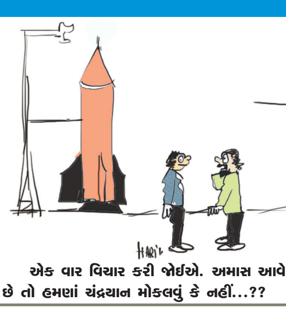
એક વાર વિચાર કરી જોઈએ. અમાસ આવે છે તો હમણાં ચંદ્રયાન મોકલવું કે નહીં...??