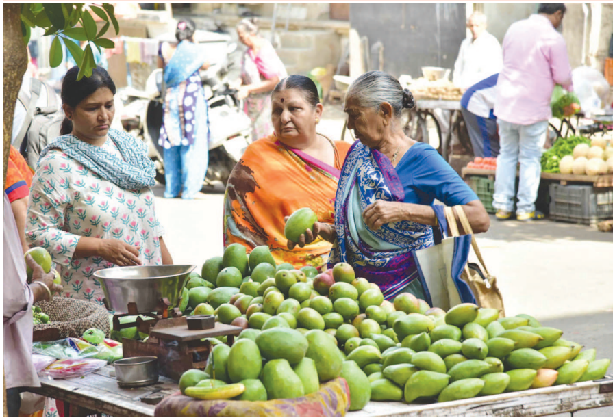
ચટાકેદાર અથાણું : ગુજરાતી થાણીનું અવિભાજ્ય અંગ બની રહેલું સ્વાદિષ્ટ અથાણાની સિઝન આરંભાઈ ચૂકી છે. શહેરમાં અથાણાની કેરીના આગમનના પગલે શકમાર્કેટમાં ગુહિણીઓ કાચી કેરી ખરીદવા ઉમટી છે.