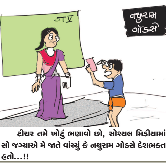
દીયર તમે ખોટું ભણાવો છો, સોશયલ મિડીયામાં સો જગ્યાએ બે જાતે વાંચ્યું કે નયુરામ ગોડસે દેશભક્ત હતો...!!!