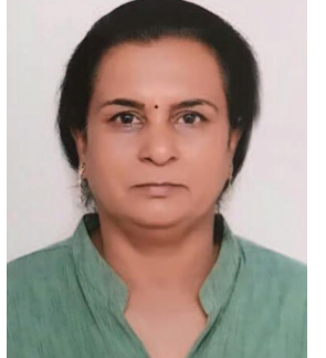
મીનાક્ષી જયસિંઘાની લાયોનેસ કલબ