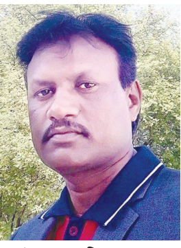
- નટવરસિંહ ચૌહાણ

“આવતીકાલે ચૂંટણીના પરિણામોમાં એકિઝટ પોલ મુજબ એનડીએને બહુમતી મળશે જ્યારે ઘણા નાગરિકોનું કહેવું છે કે મહા ગઠબંધનને બહુમતી મળશે પરંતુ હું જે વિસ્તારમાં રહું છું ત્યાં આજુબાજુના જનસંપર્કને ધ્યાનમાં રાખીને વાત કરું તો મારી ગણતરી મુજબ ભાજપને ૨૪૦, કોંગ્રેસને ૧૬૬ તથા અન્યને ૧૩૬ સીટો મળશે. એકિઝટ પોલ સાચો પણ પડી શકે અથવા ખોટો પણ પડી શકે પરંતુ સાચું પરિણામ જનતા આપે તે જ ખરું.”