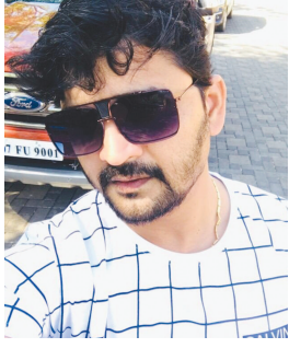
- નિતિન પટેલ

“એકીકીટ પોલ મોટાભાગે સાચા હોય છે. બે-પાંચ બેઠકોનું આધા-પાછું થતું હોય છે. લોકસભામાં ભાજપ ૩૦૦થી વધુ બેઠકો મેળવી પૂર્ણ બહુમતિથી સરકાર રચાશે. આજનો યુવાવર્ગ મોદીજીને લીડર તરીકે જોઈ રહ્યો છે. જે દેશને આગળ લઈ જશે.”