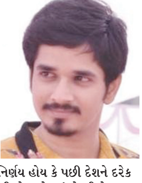
- નિસર્ગ ડાબ

“શિક્ષિત અને જાગૃત દેશની જનતાએ છેલ્લાં પાંચ વર્ષ દરમિયાન એનડીએ સરકારની ઉત્કૃષ્ટ કામગીરી જોઈ છે. ૧૦મી લોકસભાની ચૂંટણીઓમાં મતદારોએ રાષ્ટ્રીય સુરક્ષા, રાષ્ટ્રવાદ, વિકાસ તથા મોંઘવારી મુદ્દે એનડીએ સરકારની કામગીરી જોઈ ફરી પસંદ કરી હોય તેવું જણાય છે. ગરીબ-મધ્યમ વર્ગ માટેના સંતોષકારક કાર્યો હોય કે દુશ્મનોને ઘરમાં ઘુસીને મારવાનો નિર્ણય હોય કે પછી દેશને દરેક ક્ષેત્રે વિશ્વ ક્લેવક પર મુકવાની ઉપલબ્ધી હોય દરેકમાં એનડીએ અન્ય પક્ષોની સરકારથી ચડી જાય છે તેથી એકિઝટ પોલ સાચા પડશે તેવું જણાય છે.”