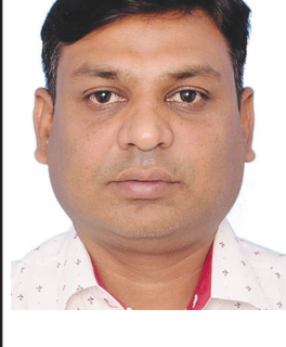
- અમિત પટેલ

“બીજેપી ૨૮૦ પ્લસ અને એનડીએ ૩૨૦ પ્લસ પોલીટીકલ પાર્ટીઓ પોતાની હાર પચાવી શકતા ન હોવાથી વિવિધ બહાના બતાવી લોકજનમતનો વિરોધ કરી રહ્યા છે. એકીકીટ પોલ કરતા પણ સાચું પરિણામ ભારતીય જનતા પાર્ટી મેળવશે અને ગુજરાતમાંથી ૨૬ બેઠકો પર ભગવો લહેરાશે.”