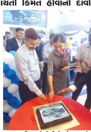
મુખ્ય ફિચર્સ જોઈએ તો ૭ સ્પીડ ડીસીટી, વાયરલેસ ચાર્જર, એર પ્યુરિફાયર, પ્રોજેક્ટર ફોગ લેમ્પ્સ, એચડી ડિસ્કલે સ્કીન, કોમ આઉટ સાઈડ ડોર હેન્ડલ્સ, વહીલ એર કન્ટ્રોલ્સ, આર્કમીઝ સાઉન્ડ સુડ, ઈકો-કોર્ટીંગ સાથે ૩ વર્ષની અનલિમીટેડ કિલોમીટરની વોરંટી ઉપરાંત ૩ વર્ષ આરએસએની સુવિધાનો સમાવેશ થાય છે. હ્યુન્ડાઈની નવી 'વેન્યુ'માં પેનિક નોટિફિકેશન બટન છે જે દબાવતા પોલીસ સ્ટેશન સહિત ચાર જગ્યાએ મેસેજ મોકલે છે. જે મહિલાઓ કે વુદ્ધો માટે જોખમના સમયે ઉપયોગી સાબિત થશે. આ ઉપરાંત સ્પીડ એલર્ટ ફિચર નિયત કરેલ સ્પીડ કરતા કાર વધુ સ્પીડ પકડે તો એલર્ટ કરે છે.