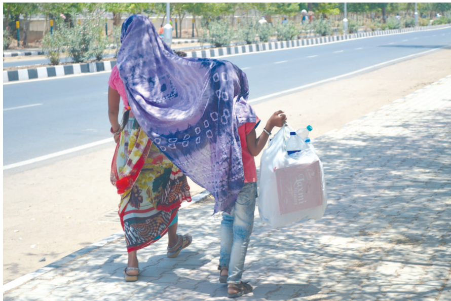
પખવાડિયામાં પુન: ગરમીનો વર્તાઈ રહી છે. મહત્તમ તાપમાન અનુભવ કર્યો હતો. આખો દિવસ

૪૨.૮ ડિ.સે. પહોંચી જતા વસાહતીઓએ આકરી ગરમીનો