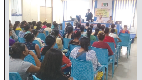
ગાંધીનગર, તા. ૨૨ અમુક પ્રકારના કેસોનું જે કોર્ટમાં દાખલ થઈ ગયા હોય તેવા પ્રકારના કેસોનું પણ કોર્ટ બહાર પણ ગકાયદેસરનું સુખદ સમાધાન શક્ય છે જે મિડિયેશન મધ્યસ્થીકરણ દ્વારા નિરાકરણ થઈ શકે છે. જેની જાગૃતિ ફેલાવવા અને વિસ્તૃત સમજણ આપવા જિલ્લા કાનૂની સેવા સત્તામંડળ ગાંધીનગર ડિસ્ટ્રીક્ટ એન્ડ સેસન્સ કોર્ટના ઉપક્રમે 'મિડિયેશન અવેરનેસ' અંગેની એક માહિતીસભર કાનૂની શિબિરનું આયોજન શહેરની એક પ્રભાવશાળી સરકારી સંસ્થા આઈ.ટી.આઈ. (મહિલા) સે. ૧૫ ખાતે કરવામાં આવ્યું હતું. આ શિબિરમાં પોસ્ટ લીટીગેશન કેસો જે કોર્ટમાં ચાલવા ઉપર આવેલા છે અને પ્રિલીટીગેશન કોર્ટમાં કેસ દાખલ કરવા પહેલાં સમાધાન પણ કોર્ટ કરાવી શકે તે અંગે વિસ્તારપૂર્વક છણાવટ કરવામાં આવી હતી.