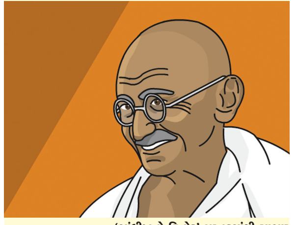
'ગાંધીજીનો વિનોદ' પુસ્તકમાંથી સાભાર