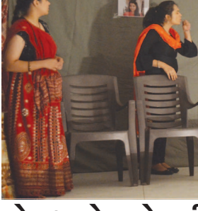
સે. ૩ એસ.એસ.વી. કેમ્પસ ખાતે સ્નેહના સગપણ નાટક એસ.એ.સ.વી. કેમ્પસમાં યોજાયેલ સ્નેહના સગપણ નાટક માણવા મોટી સંખ્યામાં કલાપ્રેમીઓ અને વિદ્યાર્થીઓ ઉપસ્થિત રહ્યા હતા.

ગુજરાત વિદ્યુત બોર્ડના નિવૃત્ત તથા હાલ જી.યુ.વી.એન.એલ. અને તેની સંલગ્ન કંપનીઓના વર્ગ ૧ થી ૪ ના નિવૃત્ત કર્મચારી અધિકારીઓનું પ્રથમ અધિવેશન તા. ૧૧ અને ૧૨ જુનના રોજ અંબાજી ખાતે વિશ્વકર્મા મેવાડા સુધાર સમાજ દ્વારા ઘોડા પાતે યોજનાર છે. મંડળના ઉચ્ચ અધિકારી-ઉજ્જવળ સહિતના મહાનુભાવોને વિશેષ આમંત્રણ આપવામાં આવેલ છે. ગુજરાતભરના તમામ નિવૃત્ત વિદ્યુત કર્મચારીઓ અધિકારીઓ હાજર રહીને પોતાના હિતની રક્ષા અંગે વિચારણા કરાશે.