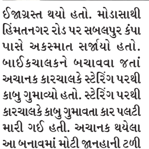
ઈજાગ્રસ્ત થયો હતો. મોડાસાથી હિંમતનગર રોડ પર સબલપુર કંપા પાસે અકસ્માત સર્જાયું હતો. બાઈકચાલકને બચાવવા જતાં અચાનક કારચાલકે સ્ટેરિંગ પરથી કાબુ ગુમાવ્યો હતો. સ્ટેરિંગ પરથી કારચાલકે કાબુ ગુમાવતા કાર પલટી મારી ગઈ હતી. અચાનક થયેલા આ બનાવમાં મોટી જાનહાની ટળી

હતી, પણ કારચાલકને સામાન્ય ઈજાઓ પહોંચી હતી. અકસ્માતને પગલે