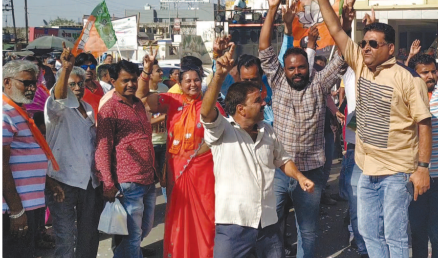
મતગણતરીને લઈ સૌ કોઈ પરિણામની રાહ જોતા ભારે આતુર કરીએ સુરત, નવસારી અને બારડોલીમાં ભાજપનો દબદબો જામ્યો હતો. વલસાડ લોકસભા બેઠકની ચૂંટણીમાં સતત બીજી

જોવા માટે કહેલું જોવા મળ્યું હતું ત્યારે આજે યોજાઈ રહેલી અને ઉત્સુક જોવા મળ્યા હતા. દક્ષિણ ગુજરાતની બેઠકોની વાત જોવા મળ્યો હતો તો, જ્યારે વલસાડમાં ખરાબરીનો જંગ ટર્મમાં મતદાનની ટકાવારીનો નવો રેકોર્ડ નોંધાયો છે. જે વર્ષ ૧૯૫૬થી કુલ ૧૬ ચૂંટણીમાં સર્વાધિક રહ્યો છે. વર્ષ ૨૦૦૮માં મતદાનની ટકાવારી ૫૬.૧૧ હતી, જે વર્ષ ૨૦૧૪માં ૭૩.૯૯ થઈ હતી. જ્યારે આ ચૂંટણીમાં તે વધીને ૭૫.૨૧ ટકા પર પહોંચતા એક નવો રેકોર્ડ સ્થાપિત થયો હતો. એકઝીટ પોલ બાદ ભાજપ ગેલમાં હતું, તો કોંગ્રેસ પરિણામોની રાહ