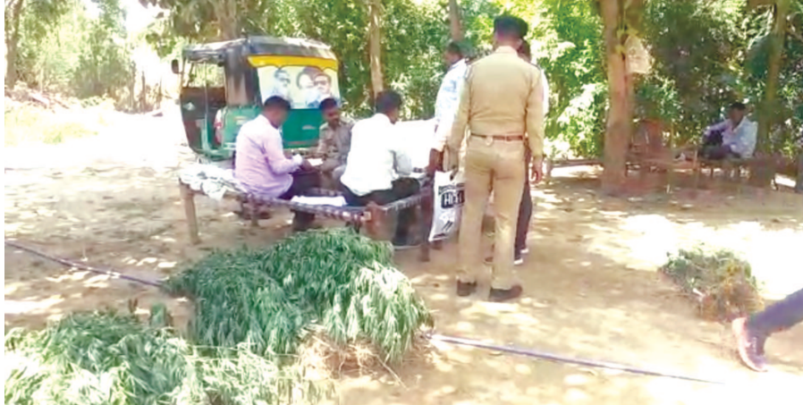
પાલનપુર આર.ટી.ઓ સર્કલથી ધનિયાણા

પાલનપુર પાયાનોયર ડેરી પાસે આવેલ એક ગો શાળામાં ગાંજાના છોડ ઉગાડવામાં આવતા પોલીસએ બાતમીના આધારે રેડ કરી ૬૨ કિલો ગાંજાનો જથ્થો કબજે કરવામાં આવ્યો હતો. જેમાં પોલીસે રૂ. ૩.૭૨ લાખનો મુદામાલ કબજે કરી કાયદેસરની કાર્યવાહી હાથ ધરવામાં આવતા ગુનેગારોમાં ફફડાટ પ્રસરી ગયો છે.