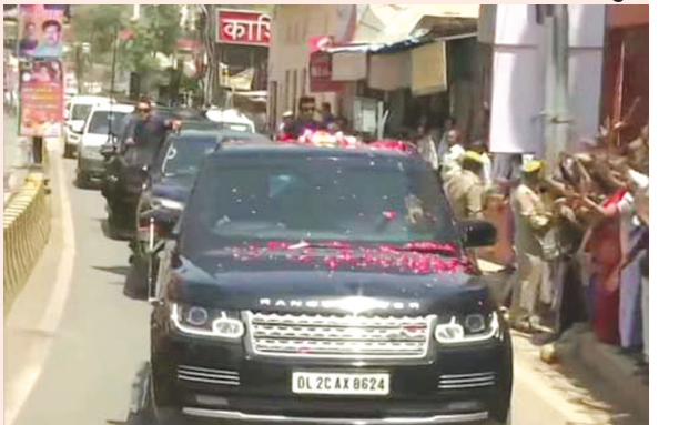
આયોજન કરવામાં આવ્યું હતું. પ્રથમ વખત નરેન્દ્ર મોદી કારોબારી વડાપ્રધાન તરીકે કાશી વિશ્વનાથ મંદિરમાં પહોંચ્યા હતા. ૩૦મી મેના દિવસે દેશના વડાપ્રધાન તરીકે તેઓ ફરી શપથ લેનાર છે. ૨૦ ક્વિન્ટલ ગુલાબની વ્યવસ્થા આજે કરવામાં આવી હતી. કાશી વિસ્તારના નાયબ અધ્યક્ષ અને મિડિયા પ્રભારી ધર્મેન્દ્રસિંહે માહિતી આપતા કહ્યું હતું કે, સમગ્ર કાશી ભગવા મય કરી દેવામાં આવ્યું હતું.

વારાણસી, તા. ૨૭ લોકસભાની ચૂંટણીમાં ઐતિહાસિક જીત મેળવી લીધા બાદ વડાપ્રધાન નરેન્દ્ર મોદી પ્રથમ વખત પોતાના સંસદીય ક્ષેત્ર વારાણસીમાં પ્રજાનો આભાર માનવા માટે પહોંચ્યા હતા. મોદીનું વારાણસીમાં જોરદાર સ્વાગત કરવામાં આવ્યું હતું. સ્વાગતમાં મોદી સંખ્યામાં લોકો ઉમટી પડ્યા હતા. મોદીના સ્વાગતમાં લોકો માર્ગની બંને બાજુએ ઉભા રહેલા નજરે પડ્યા હતા. પુષ્પવર્ષા કરવામાં આવી હતી. વડાપ્રધાન ઉપર પુષ્પ વર્ષા કરવા માટે ૨૦ ક્વિન્ટલ ગુલાબની વ્યવસ્થા કરવામાં આવી હતી. મોદીના સ્વાગત માટે સમગ્ર શહેરમાં ધ્વજ અને બેનરો અને ભગવા રંગના ફુગ્ગાઓ લગાવવામાં આવ્યા હતા. વડાપ્રધાન આજે સવારે ૯.૩૦ વાગે વારાણસી પહોંચી ગયા હતા. રાજ્યપાલ રામ નાયક અને મુખ્યમંત્રી યોગી આદિત્યનાથની સાથે સાથે ભાજપ અધ્યક્ષ અમિત શાહ પણ ઉપસ્થિત રહ્યા હતા. કાશી વિશ્વનાથ મંદિરને પણ ફુલમાળાઓથી વિશેષરીતે શણગારવામાં આવી હતી. મોદી પોલીસ લાઈનથી