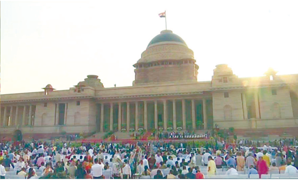
શપથવિધિ સમારોહ : નરેન્દ્ર મોદીની સેકન્ડ ઈનિંગ ધમાકેદાર આરંભાઈ હતી. આજે પ્રધાનમંત્રી શ્રી નરેન્દ્ર મોદીએ બીજી વખત તેમની સરકારના શપથગ્રહણ કર્યાં હતા. આ પ્રસંગે દેશની જાણીતી હસ્તીઓ અને રાજકીય આગેવાનો મોટી સંખ્યામાં ઉપસ્થિત રહ્યા હતા. દેશ - વિદેશના આઠ હજારથી વધારે મહેમાનોની ઉપસ્થિતિમાં યોજાયેલ શપથવિધિ દેશના ઇતિહાસમાં એક અનોખી ઘટના નોંધાઈ હતી.