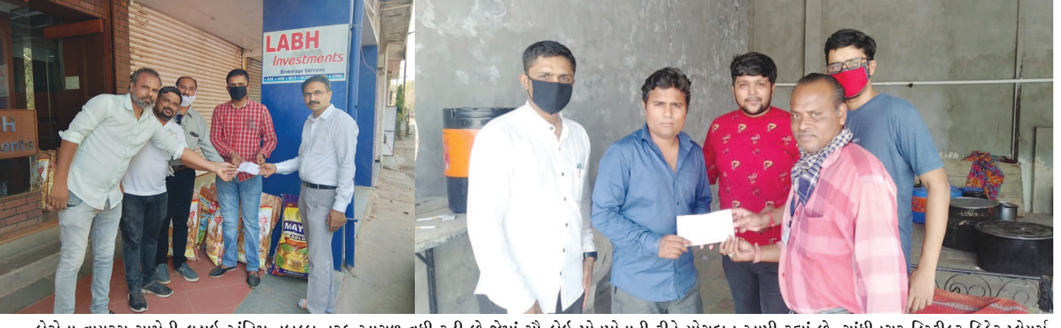
કોરોના વાયરસ સામેની લડાઈ અંતિમ તબક્કા તરફ આગળ વધી રહી છે જેમાં સૌ કોઈ પોતપોતાની રીતે યોગદાન આપી રહ્યાં છે. ગાંધીનગર ડિસ્ટ્રીક્ટ ક્રિકેટ પ્લેયર્સ એસોસિએશન દ્વારા શહેરમાં જરૂરીયાતમંદ વર્ગના શ્રમિક પરિવારોને આ કટોકટીના સમયમાં જીવન જરૂરી કરિયાણાની નિ:શુલ્ક કીટનું વિતરણ કરતી બે સંસ્થાઓ 'યુથ ફાઉન્ડેશન' અને 'યુનિટી ઓફ ગાંધીનગર' એમ બંને સંસ્થાઓને પ્રતિ સંસ્થા રૂ. ૫ હજાર લેખે કુલ રૂ. ૧૦ હજારનું દાન આપી એક પ્રેરણાત્મક ઉદાહરણ પૂર્વ પાડ્યું છે.