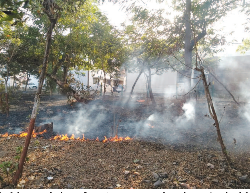
ઉનાળો ધીમે ધીમે આકરો બની રહ્યો છે. આકાશમાંથી અગનગોળ વરસી રહ્યા છે. જેના કારણે અસહ્ય ગરમી વધી છે. આવા સમયે શહેરના વનવિસ્તારમાં આગ લાગવાના બનાવો વધ્યા છે. ઘર-ઘર સર્કલ પાસે આવેલી અડીમાં આગ લાગતા તેનો ફેલાવો ખૂબ વધ્યો હતો. પવનની ગતિ વધુ રહેતા આગ ઝડપથી પ્રસરી હતી.