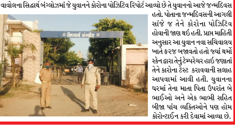
વાવોલના સિદ્ધાર્થ બંગલોઝમાં જે યુવાનને કોરોના પોઝિટિવ રિપોર્ટ આવ્યો છે તે યુવાનનો આજે જન્મદિવસ હતો. પોતાના જન્મદિવસની આગલી સાંજે જ તેને કોરોના પોઝિટિવ હોવાની જાણ થઈ હતી. પ્રાપ્ત માહિતી અનુસાર આ યુવાન નવા સચિવાલય ખાતે ફરજ બજાવતો હતો જ્યાં થઈ સ્ટેન દ્વારા તેનું ટેમ્પરેચર હાઈ જણાતાં તેને કોરોના ટેસ્ટ કરાવવાની સલાહ આપવામાં આવી હતી. યુવાનના ઘરમાં તેના માતા પિતા ઉપરાંત બે ભાઈઓ અને એક ભાભી સહિત બીજા પાંચ વ્યક્તિઓને પણ હોમ કોરોન્ટાઇન કરી દેવામાં આવ્યા છે.

સોસાયટીના દરવાજે તેનાત પોલીસનો સંપર્ક સાધવા જણાવ્યું છે. બીજી તરફ વાવોલ ગામ તથા વાવોલની નવ વિકસિત સોસાયટીઓમાં પણ આ કેસને પગલે ફફડાટની સ્થિતિ જોવા મળી રહી છે. સમગ્ર વાવોલમાં આજે સવારે જ આ વાત વાયુ વેગે પ્રસરી જતાં દિવસભર ચર્ચાનો મુખ્ય મુદ્દો બની હતી. હજુ ત્રણેક દિવસ પહેલાં જ વાવોલ ગ્રામ પંચાયત દ્વારા વાવોલ ગામમાં કોળાના સંક્રમણને પ્રવેશ ના