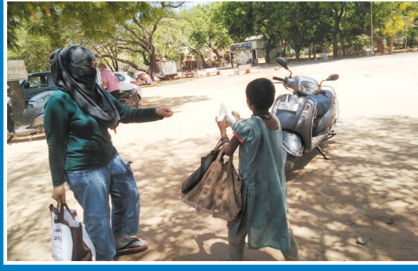
હાલમાં કપરો સમય ચાલી રહ્યો છે. લોકડાઉનના સમયમાં વેપાર વાણિજ્યની તમામ પ્રવૃત્તિઓ બંધ હોવાથી મજૂર વર્ગને તકલીફ પડી રહી છે. શોપીંગ સેન્ટર પાસે ઉભી રહી ભીખ માંગતી આ નાનકડી બાળકી આવતા જતા તમામનું ધ્યાન ખેંચી રહી છે.