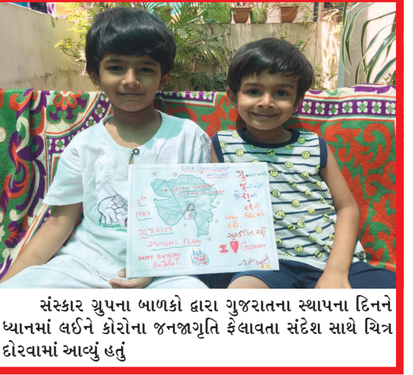
સંસ્કાર ગ્રુપના બાળકો દ્વારા ગુજરાતના સ્થાપના દિને ધ્યાનમાં લઈને કોરોના જનજાગૃતિ ફેલાવતા સંદેશ સાથે ચિત્ર દોરવામાં આવ્યું હતું