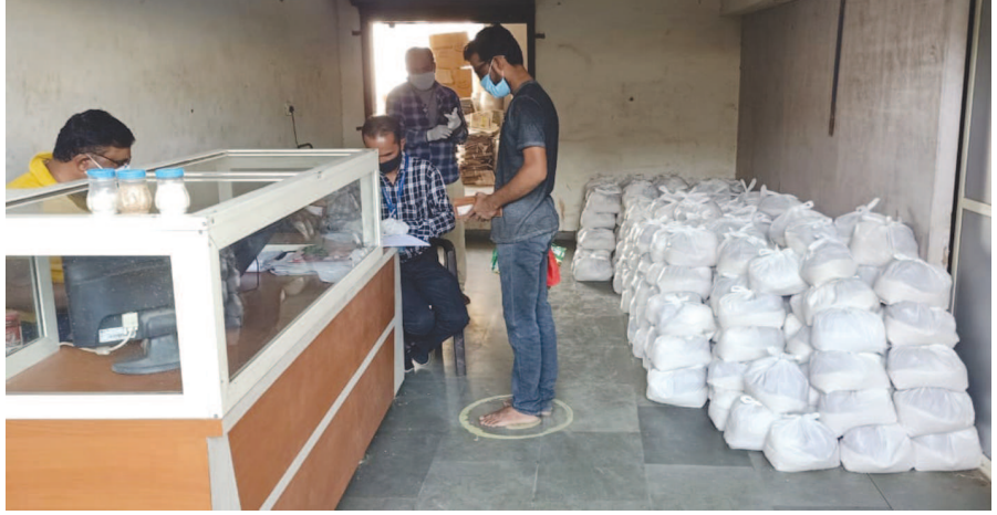
સોશિયલ ડિસ્ટન્સના ચુસ્ત પાલન, વ્યાજબી ભાવની દુકાનની સરાહનીય વ્યવસ્થા

હિંમતનાગરને અડીને આવેલ ઝહીરાબાદ વિસ્તારના કિકાચતનગર, સંજરનગર, રહેમતનગર, સતનગર, લાલપુર સહિતના વિસ્તાર માટેની પાણી પુરવઠા માટે આવેલ એમ. એમ. મનસુરી સંચાલિત સરકાર માન્ય વ્યાજબી ભાવની દુકાન ઉપર કોરોનાને લઈ સોશિયલ ડિસ્ટન્સ જળવાઈ રહે તેમ જ એક પણ રાશનકાર્ડ ધારક પુરવઠાનો નિયત જથ્થો મેળવવાથી વંચિત ન રહી જાય તે માટે દુકાનના સંચાલક દ્વારા અસરકારક આયોજન કરવામાં આવ્યું છે. જેની જિલ્લા કલેક્ટર સી. જે. પટેલ સહિત પુરવઠાના અધિકારીઓએ સરાહના કરી છે. ૨૦૦૦ થી પણ વધુ રેશનકાર્ડ ધારકોથી જોડાયેલ આ વ્યાજબી ભાવની દુકાન ઉપર જથ્થો લેવા ભીડ ન થાય તે માટે અગાઉથી ઘઉં, ચોખા, ખાંડ અને ચણાની દાળની કીટ બનાવીને તેયાર રાખવામાં આવે છે જેના કારણે ગ્રાહક જથ્થો લેવા માટે આવે ત્યારે તેના કાર્ડમાં એન્ટ્રી કરી રજીસ્ટરમાં નોંધ કરી જથ્થાનું વિતરણ કરવામાં આવે છે જેના કારણે ગ્રાહકનો સમય બગડતો નથી અને ભીડ પણ થતી નથી બે હજારથી વધુ રેશનકાર્ડ ધારકો હોવા છતાં આ દુકાને સોશિયલ ડિસ્ટન્સનું ચુસ્તપણે પાલન કરી આસાનીથી અનાજનું વિતરણ થઈ રહ્યું છે. જિલ્લાભરમાં દુકાનની આ વ્યવસ્થાની સરાહના થઈ રહી છે.