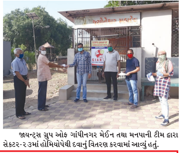
જાયન્ટ્સ ગ્રુપ ઓફ ગાંધીનગર મેઈન તથા મનપાની ટીમ દ્વારા સેક્ટર-૨ રૂમમાં હોમિયોપેથી દવાનું વિતરણ કરવામાં આવ્યું હતું.