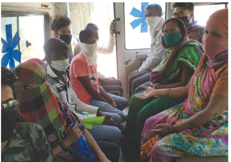
સુવેરાનો આક્ષેપ છે કે આમ એક તરફ સરકાર અને તંત્ર સોશિયલ ડિસ્ટન્સિંગની વાતો કરે છે કે લોકો સોશિયલ ડિસ્ટન્સિંગ જાળવે. ત્યારે એમ્બ્યુલન્સમાં ભરીને કોરોનાનો ટેસ્ટ કરાવવા લાવવામાં આવ્યા છે. વધુમાં આ તમામ લોકો હોમકોરોન્ટાઇન કરેલ વ્યક્તિઓ વ્યક્તિનો પણ કોરોના રિપોર્ટ પોઝિટિવ આવ્યો તો અન્ય વ્યક્તિઓને પણ કોરોનાનું સંક્રમણ થઈ શકે તેવું તંત્ર જાણતું

આ વ્યક્તિઓ સવારથી કોરોનાનો ટેસ્ટ કરાવવા આવ્યા હતા છતાં તંત્ર દ્વારા જમવાની કે ચા નાસ્તાની વ્યવસ્થા કરવામાં નહોતી આવી. સાથે જ આ તમામ લોકો ઉનાળાના આકરા તાપમાં હોસ્પિટલની બહાર બેસી રહેવા મજબૂર બન્યા હતા. ત્યારે કોરોના સામેની જંગમાં સરકારના મસમોટા દાવાઓ સામે તંત્ર ક્યાંકને ક્યાંક સુવિધાઓ આપવામાં ઉભું ઉતરતું હોય તેવું લોકો મુખે ચર્ચાઈ રહ્યું છે.