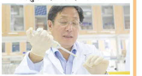
સફળ રહી હતી. તેમણે જણાવ્યું હતું કે કોરોના ચેપવાળા ઉંદર પર ડ્રગ પરીક્ષણ દરમિયાન તેમને