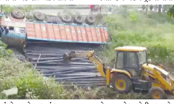
રોડ પર પડેલા લોહીવાળા લોખંડના પાઈપોને હટાવવાની કામગીરી હાથ ધરવામાં આવી.

પટના, તા. ૧૯ બિહારના ભાગલપુર-નવગછિયામાં એક રોડ અકસ્માતમાં નવ પ્રવાસી શ્રમિકોના મોત નિપજ્યાં છે. આ દુર્ઘટના શ્રમિકોથી ભરેલી બસ અને ટ્રક વચ્ચે ટક્કરને લઈને થઈ, જેમાં ૯ શ્રમિકોના મોત થયા છે, જ્યારે અન્ય શ્રમિકોને ઈજા પહોંચી છે. જો કે હજુ પણ કેટલાંક શ્રમિકો નીચે ઢટાયાં હોવાની આશંકા જોવા મળી રહી છે. હાલમાં મળેલી પ્રાથમિક જાણકારી મુજબ ૯ મૃતદેહ બહાર નીકળી લેવામાં આવ્યાં છે જ્યારે હાલમાં બચાવ-રાહત કામગીરી કરવામાં આવી રહી છે. પ્રાથમિક જાણકારી મુજબ પ્રવાસી શ્રમિકોને લઈને બસ દરબંગથી બાંકા જઈ રહી હતી. આ દરમિયાન આ દુર્ઘટના થઈ હતી. જે ટ્રક સાથે બસની ટક્કર થઈ છે, તે ટ્રકમાં લોખંડના પાઈપો હતા. જેને લઈને ટ્રકમાં સવાર કેટલાંક શ્રમિકો લોખંડની પાઈપ નીચે દબાઈ ગયેલા જોવા મળ્યાં છે. સ્થાનિક લોકો મુજબ આ દુર્ઘટનામાં હજુ પણ મૃત્યુઆંક વધે તેવી શક્યતા છે. આ દુર્ઘટના નવગછિયા ખરીકના અંભો ચોક પાસે થઈ છે. આ મામલાની જાણકારી મળતાં સ્થાનિક પોલીસ સ્ટેશ સહિત કેટલાંક વિસ્તારોની પોલીસ ઘટનાસ્થળે પહોંચી છે, ત્યાર બાદ રોડ પર પડેલા લોહીવાળા લોખંડના પાઈપોને હટાવવાની કામગીરી હાથ ધરવામાં આવી. પ્રાથમિક જાણકારી મુજબ બસ પ્રવાસી શ્રમિકોને લઈને દરબંગથી જઈ રહી હતી. આ દુર્ઘટનામાં બસમાં સવાર ૪ મુસાફરો પણ ઈજાગ્રસ્ત થયા છે.