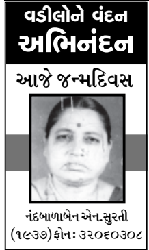
વડીલોને વંદન અભિનંદન આજે જન્મદિવસ

કડી પી.ટી.સી. કોલેજમાં સરદાર જયંતિ ઉજવાઈ