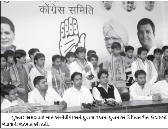
ગુરુવારે અમદાવાદ ખાતે એબીવીપી અને યુવા મોરચાના યુવાનોએ વિધિવત રીતે કોંગ્રેસમાં જોડાવાની જાહેરાત કરી હતી.