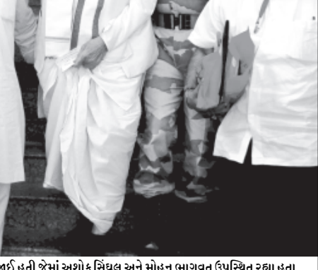
એસજીવીપીમાં ધર્મસભા યોજાઈ હતી જેમાં અશોક સિંઘલ અને મોહન ભાગવત ઉપસ્થિત રહ્યા હતા.

અમદાવાદ, તા. ૮ બદરુદીન શેખ પર હુમલો કરનાર આરોપી હનિફને પોલીસે આજે ટિન દહાડે ધોળકામાંથી પકડી પાડવામાં આવ્યા બાદ વધુ વિગત સપાટી પર આવે તેવી શક્યતા દેખાઈ રહી છે. થોડાક દિવસ પહેલા જ અમદાવાદના કોર્પોરેટર અને કોર્પોરેશનમાં કોંગ્રેસના નેતા બદરુદીન શેખ પર તલવારથી હુમલો કરવામાં આવ્યો હતો. આ બનાવને લઈને ભારે રાજકીય ગરમી જામી હતી. હુમલો કરવામાં આવ્યા બાદ આક્ષેપ-પ્રતિઆક્ષેપનો દોર શરૂ થયો હતો. ધાયલ થયા બાદ બદરુદીન શેખને હોસ્પિટલમાં ખસેડવામાં આવ્યા હતા. એવો આક્ષેપ પણ કરવામાં આવ્યો હતો કે રાજકીયરિતિ પ્રેરીત આ હુમલો હતો.