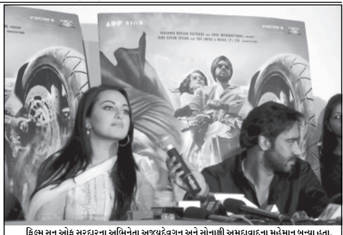
ફિલ્મ સન ઓફ સરદારના અભિનેતા અજયવેવગન અને સોનાલી અમદાવાદના મહેમાન બન્યા હતા.