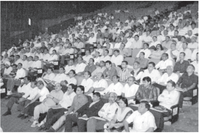
ગાંધીનગર ઉત્તર વિધાનસભા મતવિસ્તારના અધિકારીઓ અને કર્મચારીઓ માટે ચૂંટણીલક્ષી તાલીમ કાર્યક્રમ ગાંધીનગર ટાઉનહોલ ખાતે યોજાયેલો હતો.