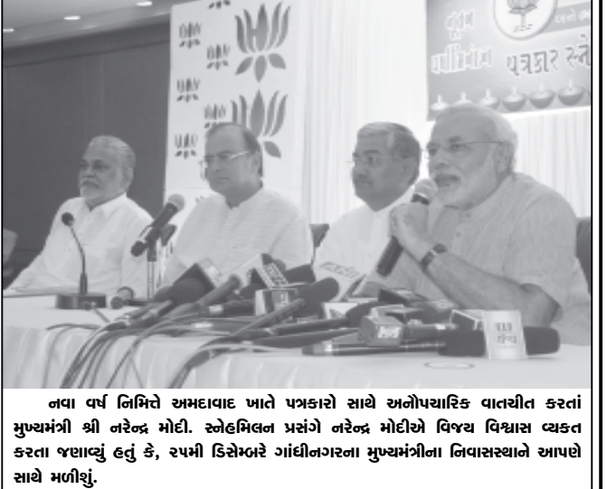
નવા વર્ષ નિમિત્તે અમદાવાદ ખાતે પત્રકારો સાથે સંલગ્નતા વાતચીત કરતાં મુખ્યમંત્રી શ્રી નરેન્દ્ર મોદી. સ્નેહમિલન પ્રસંગે નરેન્દ્ર મોદીએ વિષય વિશ્વાસ વ્યક્ત કરતા જણાવ્યું હતું કે, ૨૫મી ડિસેમ્બરે ગાંધીનગરના નિવાસસ્થાને આપણે સાથે મળીશું.