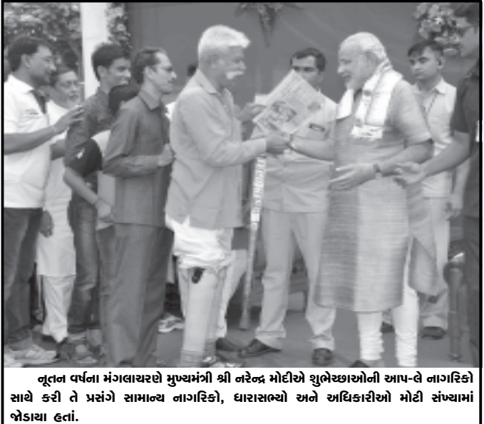
નૂતન વર્ષના મંગલાચરણે મુખ્યમંત્રી શ્રી નરેન્દ્ર મોદીએ સુભેચ્છાઓની આપ-લે નાગરિકો સાથે કરી તે પ્રસંગે સામાન્ય નાગરિકો, ધારાસભ્યો અને અધિકારીઓ મોટી સંખ્યામાં ખેડાયા હતાં.

સર્વિંગલ નામની યાદી બનાવી દીધી છે. ૧૮૨ બેઠકમાંથી ૧૦ બેઠકો એનસીપીને આપવાનું નક્કી કરવામાં આવ્યું છે. જે ૧૨૦ બેઠકો માટે સર્વિંગલ નામો નક્કી કરવામાં આવ્યા છે એમાં કોંગ્રેસના ૪૫ જેટલા ધારાસભ્યોનો સમાવેશ થાય છે. તમામ બેઠકો પર નવા સીમાકલ અને જ્ઞાતિના સમીકરણો ધ્યાને રાખીને ઉમેદવારોને પસંદ કરીને એનુ વિસ્ટ કોંગ્રેસ અધ્યક્ષા સોનિયા ગાંધીને સુપરત કરાશે. સોનિયા ગાંધી વળ દુ વન બેઠકની ચર્ચા કરીને મંજૂરીની મહોર મારશે. જે બેઠકો વિવાદાસ્પદ નથી એવી ૨૫ જેટલી બેઠકોના ઉમેદવારોના નામની જાહેરાત તા. ૨૦મી નવેમ્બરે કરવામાં આવે એવી શક્યતા છે.