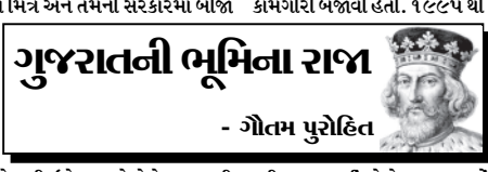
ગુજરાતની ભૂમિના રાજા - ગૌતમ પુરોહિત