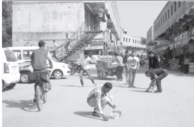
જિલ્લાના ચિલોડા જંકશન ખાતે જાણીતા અથમ્મથ કોમ્પલેક્ષ ખાતે વેપારીઓ દ્વારા ફટકડા ફોડી તથા હોલ વગાડીને અજમલ કસાબની ફાંસી બદલ ખુશાલી વ્યક્ત કરવામાં આવી હતી.