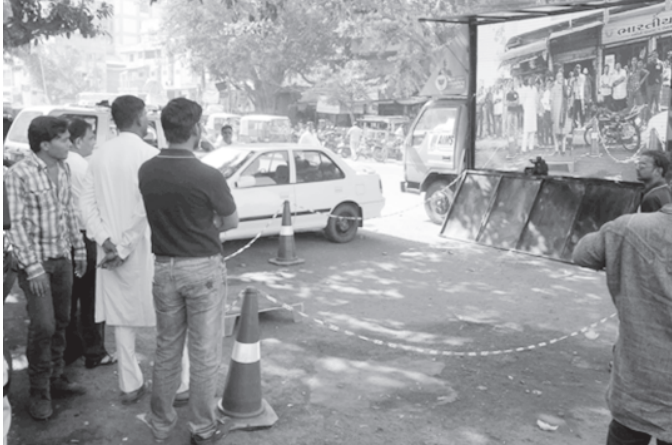
ભાજપ ઓફિસ પર સઘન પોલીસ બંદોબસ્ત ગોઠવી દેવામાં આવ્યો છે. શ્રીડી લાઈવ કાર્યક્રમની બાબતે પણ મોટી ચર્ચા સ્વરૂપે આપ્યું છે.

ગાંધીનગર, તા. ૨૩ ગુજરાત વિધાનસભા સામાન્ય ચૂંટણી-૨૦૧૨ અંતર્ગત ચૂંટણીની વિવિધ મંજૂરી માટે ઉમેદવારોને જુદી જુદી કચેરીઓમાં ફરવું ના પડે તે માટે જિલ્લા સેવા સદન તેમજ ચારેય તાલુકામાં મામલતદાર કચેરી માટે સિંગલ વિન્ડો સિસ્ટમ આજથી શરૂ કરવામાં આવી છે. આ સિંગલ વિન્ડો સિસ્ટમ ચૂંટણી-ક્રિયા સંપન્ન થાય ત્યાં સુધી અમલમાં રહેશે.