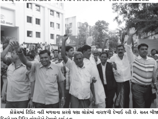
કોંગ્રેસમાં ટિકિટ નહીં મળવાના કારણે ઘણા લોકોમાં નારાજગી દેખાઈ રહી છે. સતત બીજા દિવસે પણ ટિકિટ વાંછુકોએ દેખાવો કર્યા હતા.