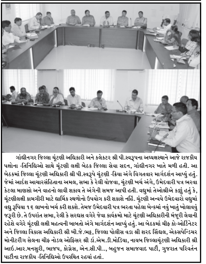
ગાંધીનગર જિલ્લા ચૂંટણી અધિકારી અને કલેક્ટર શ્રી પી.સ્વરૂપના અધ્યક્ષસ્થાને આજે રાજકીય પક્ષોના -તિનિદિઓ સાથે ચૂંટણી લક્ષી બેઠક જિલ્લા સેવા સદન, ગાંધીનગર ખાતે મળી હતી. આ બેઠકમાં જિલ્લા ચૂંટણી અધિકારી શ્રી પી.સ્વરૂપે ચૂંટણી-ક્રિયા અંગે વિગતવાર માર્ગદર્શન આપ્યું હતું. જેમાં આર્દેશ આચારસંહિતાના અમલ, સભા કે રેલી યોજવા, ચૂંટણી ખર્ચ અંગે, ઉમેદવારી પત્ર ભરવા કેટલા માણસો અને વાહનો લાવી શકાય તે અંગેની સમજ આપી હતી. વધુમાં તેઓશ્રીએ કહ્યું હતું કે, ચૂંટણીલક્ષી કામગીરી માટે ધાર્મિક સ્થળોનો ઉપયોગ કરી શકાશે નહિ. ચૂંટણી અન્યથા ઉમેદવારો વધુમાં વધુ રૂપિયા ૧૬ લાખનો ખર્ચ કરી શકશે. તેમજ ઉમેદવારી પત્ર ભરતા પહેલા બેન્કમાં નવું ખાતું ખોલાવવું જરૂરી છે. તે ઉપરાંત સભા, રેલી કે સરઘસ વગેરે જેવા કાર્યક્રમો માટે ચૂંટણી અધિકારીની મંજૂરી લેવાની રહેશે વગેરે ચૂંટણી લક્ષી મહત્વની બાબતો અંગે માર્ગદર્શન આપ્યું હતું. આ બેઠકમાં ચીફ કો-ઓર્ડિનેટર અને જિલ્લા વિકાસ અધિકારી શ્રી બી.જી.ભટ્ટ, જિલ્લા પોલીસ વડા શ્રી શરદ સિંઘલ, એક્સપેન્ડિચર મોનીટરીંગ સેલના ચીફ નોડલ ઓફિસર શ્રી ડી.એમ.ડી.મોડિયા, નાયબ જિલ્લાચૂંટણી અધિકારી શ્રી આર.આર.મનસુરી, ભાજપ, કોંગ્રેસ, એન.સી.પી., બહુજન સમાજવાદ પાર્ટી, ગુજરાત પરિવર્તન પાર્ટીના રાજકીય -તિનિદિઓ ઉપસ્થિત રહ્યાં હતાં.

બીજા તબક્કાની ૯૫ બેઠકો માટે ભાજપ કોંગ્રેસે ઉમેદવાર પસંદગી પ્રક્રિયા આરંભી ભાજપ પ્રદેશ પાર્લામેન્ટરી બોર્ડની ફરી મેરેથોન બેઠકનો દોર : ભાજપ ૯૫ બેઠકો માટે ૨૮મીએ ઉમેદવારોની યાદી જાહેર કરશે ગાંધીનગર, તા. ૨૪ બીજા તબક્કાની ૯૫ બેઠકો માટે ભાજપ કોંગ્રેસ અને ગુજરાત પરિવર્તન પાર્ટી દ્વારા ઉમેદવારોની પસંદગી પ્રક્રિયા હાથ ધરવામાં આવી છે અને આગામી ૨૭મી અથવા ૨૮મીએ પક્ષો દ્વારા ઉમેદવારોની યાદી જાહેર કરવામાં આવનાર હોવાનું જાણવા મળે છે. ગુજરાત વિધાનસભાની ૧૮૨ બેઠકો માટેની ચૂંટણી બે તબક્કામાં યોજાનાર છે. જેમાં પ્રથમ તબક્કા માટેની ૮૭ બેઠકો માટેનું જાહેરનામુ પ્રસિદ્ધ થઈ ગયું હતું અને એના માટે આજે ૨૪મી નવેમ્બર-૨૫ના રોજ ઉમેદવારીપત્રો ભરવાની પ્રક્રિયા પણ પૂર્ણ થઈ જવા પામી છે. બીજા તબક્કાની ૯૫ બેઠકો માટેનું જાહેરનામુ ગઈકાલે પ્રસિદ્ધ થતાં