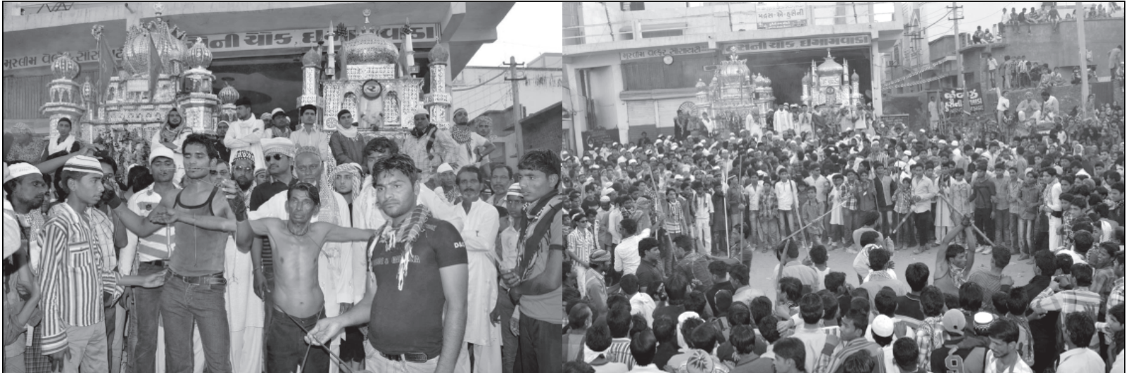
હિંમતનગર શહેરમાં મહોરમ શરીફનો તહેવાર ખૂબ જ દબદબાભરે ચૂસ્ત બંદોબસ્ત સાથે શાંતિપૂર્વક ઉજવાયો હતો. શહેરના મુસ્લિમ બિરાદરો અને હિન્દુભાઈઓ-બહેનોના એકચ્છમ સમગ્ર તાજીયા જુલુસ નગરચ્યામાં નિકળ્યું હતું અને હજારોની જનમેદની સાથે સંપન્ન થયું હતું.