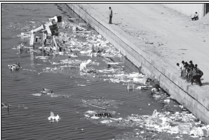
અમદાવાદમાં આવેલી સાબરમતી નદીમાં તાજીયા પધરાવવામાં આવ્યા હતા.