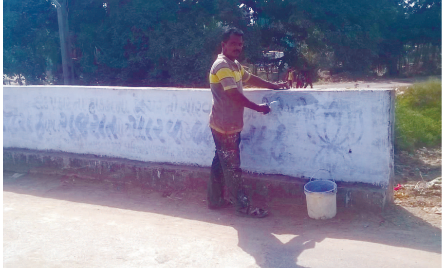
આચારસંહિતાની અમલદારી લખાણો દૂર કરવાનું ગુજરાત વિધાનસભા-૨૦૧૭ની ચૂંટણી જાહેર થતાં શહેર અને જિલ્લામાંથી રાજકીય પક્ષોના બેનર્સ-લોડિંગ તથા લખાણો દૂર કરવાની કામગીરી આરંભાઈ ચુકી છે. વિધાનસભાની ચૂંટણીને અનુલક્ષી ચૂંટણીપંચ આદેશ મુજબ આચારસંહિતાની અમલદારી રૂપે ચિલોડા ગ્રામ પંચાયત દ્વારા જાહેર માર્ગો, ભીતી, દિવાલો પરના લખાણો દૂર કરવા સફેદ રંગનો કુચડો ફેરવવામાં આવી રહ્યો છે.