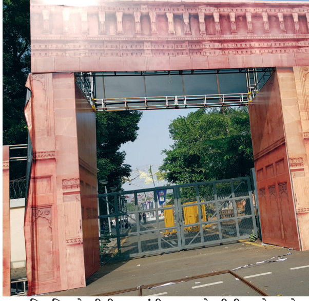
સિરામિક એક્ઝીબીશન : ગાંધીનગરના એક્ઝીબીશન સેન્ટર સેક્ટર-૧૭ ખાતે ૧૬ થી ચાર દિવસ માટે સિરામિક એક્ઝીબીશન આરંભાશે. છેલ્લા ચાર દિવસથી તડામાર તૈયારીઓ ચાલી રહી છે.

ગાંધીનગર, તા. ૧૩ ગાંધીનગર મહાનગરપાલિકા દ્વારા શહેરના જાહેર શૌચાલયોની સ્વચ્છતા અંગે ફિડબેક સિસ્ટમ સ્વચ્છતા સર્વેક્ષણની તૈયારીના ભાગરૂપે લગાવવાનો નિર્ણય કરેલ છે. શહેરમાં મનપા દ્વારા જાહેર શૌચાલયમાં આ ફિડબેક સિસ્ટમ લગાડવાની કામગીરી પણ હાથ ધરી દેવામાં આવી છે. ૨૦થી વધુ શૌચાલયોમાં તે લાગી ચુકી છે અને મંગળવાર સાંજ સુધીમાં બાકીના તમામ શૌચાલયોમાં તે લાગી જશે. આ ફિડબેક સિસ્ટમનું મનપાની કચેરીમાંથી રોજરોજ મોનીટરીંગ પણ કરવામાં આવશે. આ માટેની વ્યવસ્થા ઉભી કરાઈ