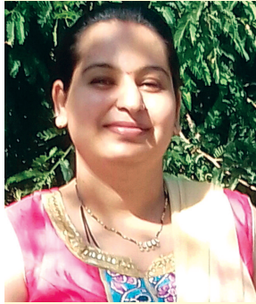
ધારા ધવલકુમાર મોદી