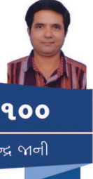
ગાંધી ૧૦૦ ડો. રાજેન્દ્ર જામ્બાની

છેદ ઉડાડીને જ્ઞાતિવાદી રાજકારણને સત્તાનાં સૂત્ર હસ્તગત કરવાનું એક આગવું હથિયાર બનાવી દીધું છે. અરે જ્ઞાતિ પ્રથા દૂર કરવાની વાત તો દૂર રહી પણ તેનાથી એક ડગલું આગલ જઈને ‘પેટા જ્ઞાતિ’ના સમીકરણોના ચોંકાં ગોઠવેને ચૂંટણી ચોપટ જીતવાના પ્રયાસો હાથ ધરાયા છે. ગાંધી જ્ઞાતિ-જ્ઞાતિ વચ્ચેની અસમાનતાની ખાઈ પૂરવાના પ્રયાસો કરતા હતા જયારે આજે ગાંધીજી ખાદી પહેરનારા રાજકારણીઓએ તો જ્ઞાતિની અંદરના પેટા સમૂહો (પેટા જ્ઞાતિ) એકબીજાની સામે લડતા રહે એવી રાજનીતિ શરૂ કરી છે, આ વરવી વાસ્તવિકતા તો જાણે પરંતુ નહીં સમગ્ર દેશમાં વ્યાપક બની છે. દોષ માત્ર રાજકારણોનો નથી, સમાજ વિજ્ઞાનીઓ, લેખકો- પત્રકારો અને બુદ્ધિજીવીઓ પણ પોતાના સમાજદર્શનને સમજાવવાના વિવરણમાં જે તે વિસ્તાર, તે વિસ્તાર જ વસ્તી, જ્ઞાતિ વ્યવસ્થાના સમીકરણમાં કંઈ જ્ઞાતિ અને તેમાં પણ ચોક્કસ જ્ઞાતિની પેટા જ્ઞાતિમાં મતદારોની સંખ્યા બાહુલ્યની અંકડાઓના આધારે અર્થઘટન કરીને સમજાવે છે. સરવાલે ચૂંટણી જીતવા માટે આંતરિક અને બાહ્ય દૃષ્ટિએ જ્ઞાતિ આધારિત રાજકારણ શરૂ થાય છે. ગાંધીએ લખ્યું છે. ‘ઐતિહાસિક દૃષ્ટિએ જોતા જ્ઞાતિ પ્રથાને ભારતીય સમાજની પ્રયોગશાળામાં એક પ્રયોગ તરીકે અથવા સામાજિક ગોઠવણ તરીકે ગણી શકાય. જો આપણે ભારતીય સમાજ વ્યવસ્થાની ઓળખ એવી જ્ઞાતિપ્રથાની સફળતા સાબિત કરી શકીએ તો આપણે લોભ અને લાલસામાંથી પેટા થતી નિર્દય હરિકાઈ અને સામાજિક વિચ્છેદન સામેના શ્રેષ્ઠ ઉપાય તરીકે ડુનિયાને ભેટ ધરી શકીએ.’ ગાંધીના જનજનને જોડીને કરાયેલા સ્વરાજ આંદોલન થકી સ્વતંત્રતા મેળવી. વિશ્વના સૌથી મોટા લોકશાહી દેશની ઓળખ પણ આપણા દેશ મેળવી પણ નાત અને જાતના સમીકરણો થકી સાચી લોકશાહી તો જાણે પણ દૂર જ હડસેલીને ?